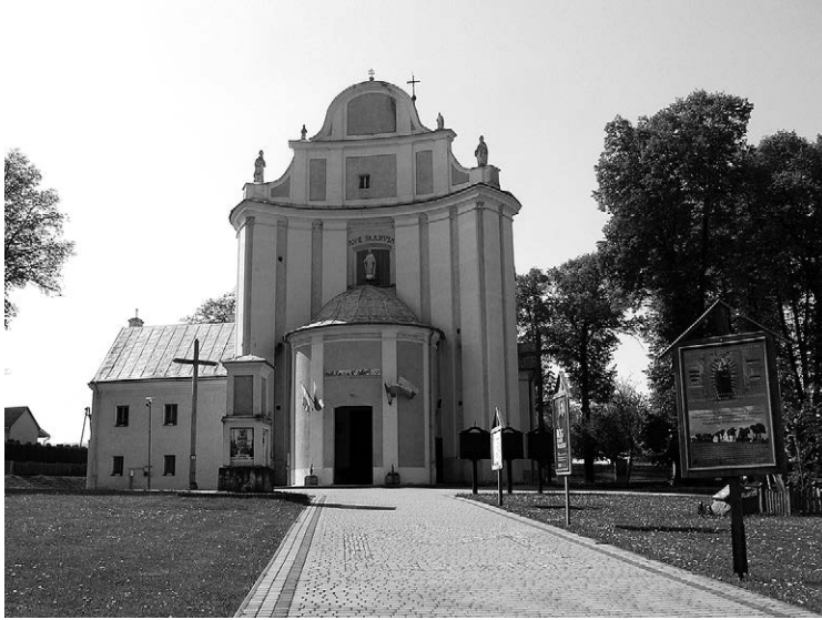
Fot. 1. Sanktuarium Niepokalanej Matki Dobrej Nadziei w Tuligłowach