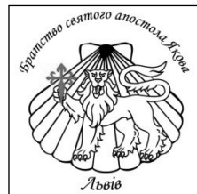
Ryc. 2. Pieczęć Lwowskiego Bractwa św. Apostoła Jakuba (projekt Taras Zawadowski)

Włączenie pierwszego ukraińskiego odcinka Jakubowego Szlaku w europejską sieć Camino de Santiago jest bardzo istotnym impulsem do rozwoju pielgrzymek i wędrówek Ukraińców Drogą św. Jakuba zarówno na Pograniczu Polsko-Ukraińskim, jak i na terenie Półwyspu Iberyjskiego. Już obecnie można zaobserwować, że z każdym rokiem wzrasta liczba Ukraińców pielgrzymujących do grobu św. Jakuba w Santiago de Compostela. W 2004 r., zaledwie 30 osób z Ukrainy otrzymało tzw. „ Compostelkę ” (dokument potwierdzający odbycie pielgrzymki do grobu św. Jakuba – ostatnich 100 km Camino de Santiago pieszo, konno lub na