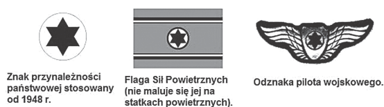
Rys. 0.2. Oznaczenia Sił Powietrznych Izraela

Spór o przynależność i kształt terytorium Izraela jest jednym z najtrudniejszych, a społeczność międzynarodowa nadal nie zdołała wykreować na ten temat ostatecznej opinii. Po tragicznych doświadczeniach (zwłaszcza z okresu II wojny światowej) środowisko żydowskie zdecydowało się utworzyć własne państwo metodą „faktów dokonanych”. W 1948 r. doszło do wojny, w wyniku której na terenie byłego Brytyjskiego Mandatu Palestyny utworzono niepodległe państwo Izrael.