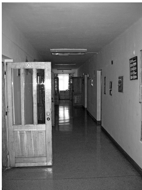
Fot. 1 i 2. Korytarze w zakładzie zamkniętym i półotwartym

W placówkach bardziej otwartych istnieją zazwyczaj rozleglejsze place, które poza tym, że umożliwiają bardziej spontaniczną interakcję pomiędzy wychowankami, na przykład w trakcie gier sportowych, takich jak bilard, tenis stołowy czy piłkarzyki, dają możliwość wprowadzenia instytucji apelu, który także służy z jednej strony kontroli podopiecznych, choć z drugiej osłabia ją