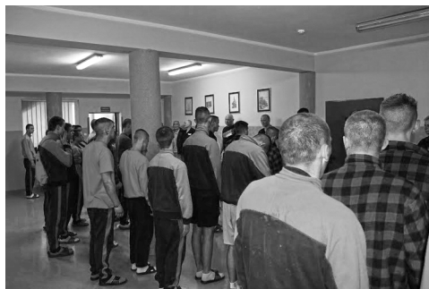
Fot. 4. Ten sam plac w trakcie apelu

Podczas apelu dochodzi do zestawienia habitusu cielesnego z oczekiwaniami kadry, która z postawy ciała wychowanków wysuwa wnioski dotyczące na przykład okazywania szacunku, motywacji do zmiany itd.