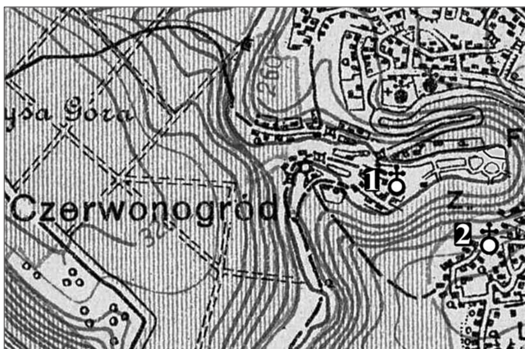
Mapa 6. Czerwonogród na mapie WIG z oznaczeniem obiektów sakralnych: 1. kościół parafialny; 2. cerkiew pw. św. Mikołaja

Kościół parafialny pw. Wniebowzięcia NMP ufundowany został przez Lisieckich w 1615 r. Konsekrowano go jednak dopiero w 1741 r. 10 Ruiny kościoła znajdują się na wzgórzu, niedaleko pozostałości pałacu Ponińskich. W 1945 r. świątynia została spalona podczas rzezi polskiej ludności. Obok znajduje się krzyż ku pamięci zamordowanych 2 II 1945 r.