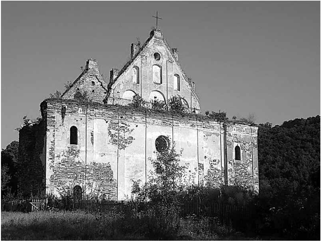
Il. 11. Czerwonogród. Ruiny kościoła pw. Wniebowzięcia NMP

W drugiej połowie XVIII w. w rejonie Czerwonogrodu i Nagórzan znajdowały się również murowana cerkiew greckokatolicka pw. św. Mikołaja oraz murowana synagoga 11 . Cerkiew istnieje do dzisiaj na terenie Nagórzan.