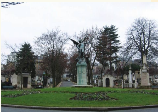
Cmentarz Montparnasse w Paryżu

W dzielnicy Paryża zwanej Montparnasse (mieszkał w niej Stanisław Wyspiański) znajduje się drugi słynny cmentarz. Założono go w 1824 r. w południowej części Paryża – znajduje się tu ok. 34 tys. grobów. Na tym cmentarzu chowano przedstawicieli intelektualnej i kulturalnej elity Francji, takich jak np. Charles Baudelaire, Jean-Paul Sartre, Simone de Beauvoir.