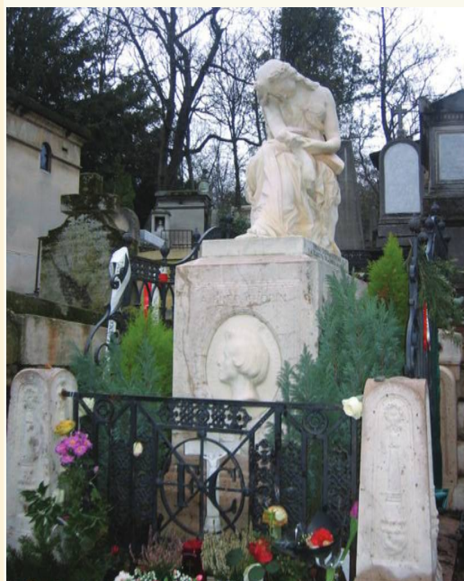
Cmentarz Père-Lachaise, grób Fryderyka Chopina

Spośród wielu Polaków pochowanych na Père-Lachaise można wymienić generałów: Jarosława Dąbrowskiego i Józefa Wysockiego, pisarkę Klementynę Hoffmanową, Marię Walewską, kochankę Napoleona i matkę jego syna (na cmentarzu znajduje się serce hrabiny). Przez licznych turystów (zwłaszcza z Azji) odwiedzany jest grób Fryderyka Chopina; napis na pomniku głosi, że Chopin urodził się w Żelazowej