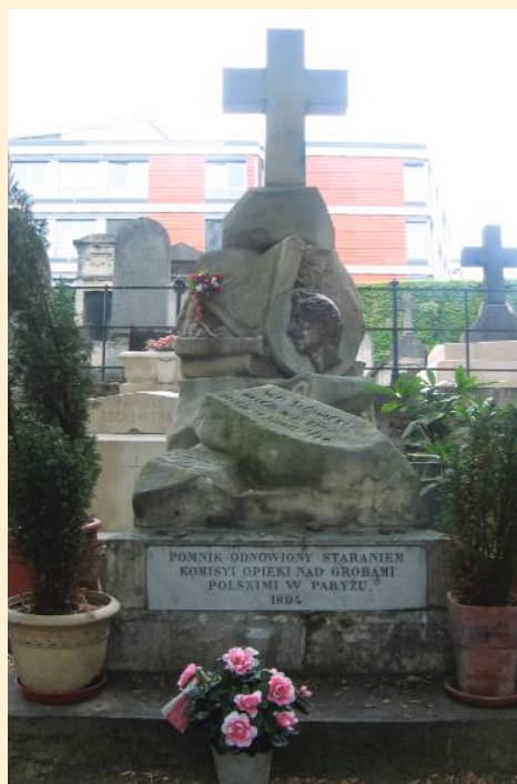
Cmentarz Montmartre, grób Juliusza Słowackiego