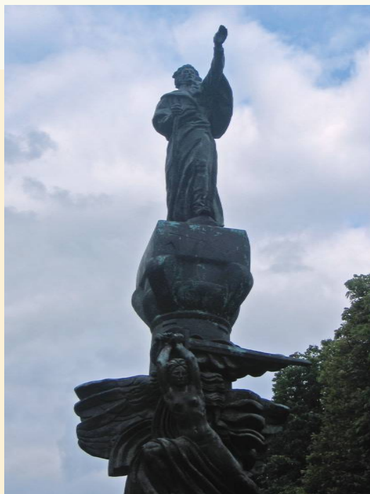
Pomnik Adama Mickiewicza w Paryżu

Warto wspomnieć o działającym w stolicy Francji od 1947 roku Instytucie Kultury Polskiej i miesięczniku „Kultura”, którego redaktorem był Jerzy Giedroyc.