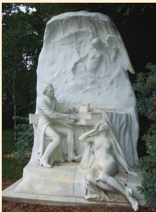
Pomnik Fryderyka Chopina w Paryżu

Nobla) wykładała na paryskiej Sorbonie. W Paryżu są dwa pomniki Fryderyka Chopina oraz pomnik Adama Mickiewicza (to właśnie w paryskim kościele św. Magdaleny 21 stycznia 1856 r. odbyła się przy trumnie wieszczki zmarłego w Konstantynopolu msza pogrzebowa); w kościele Saint-Germain-des-Prés znajduje się grobowiec króla Jana Kazimierza (z jego sercem).