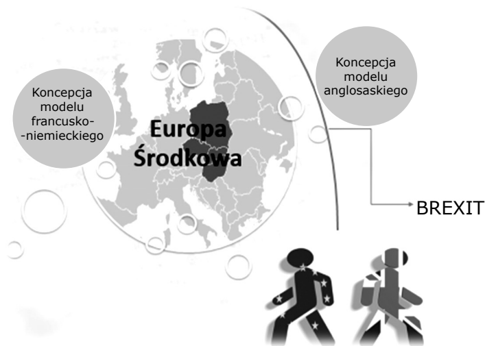
Rysunek 3. Europa Środkowa po 2016 r. – w kierunku kontynentalnego modelu rozwoju biurokracji (scentralizowany model brukselski)