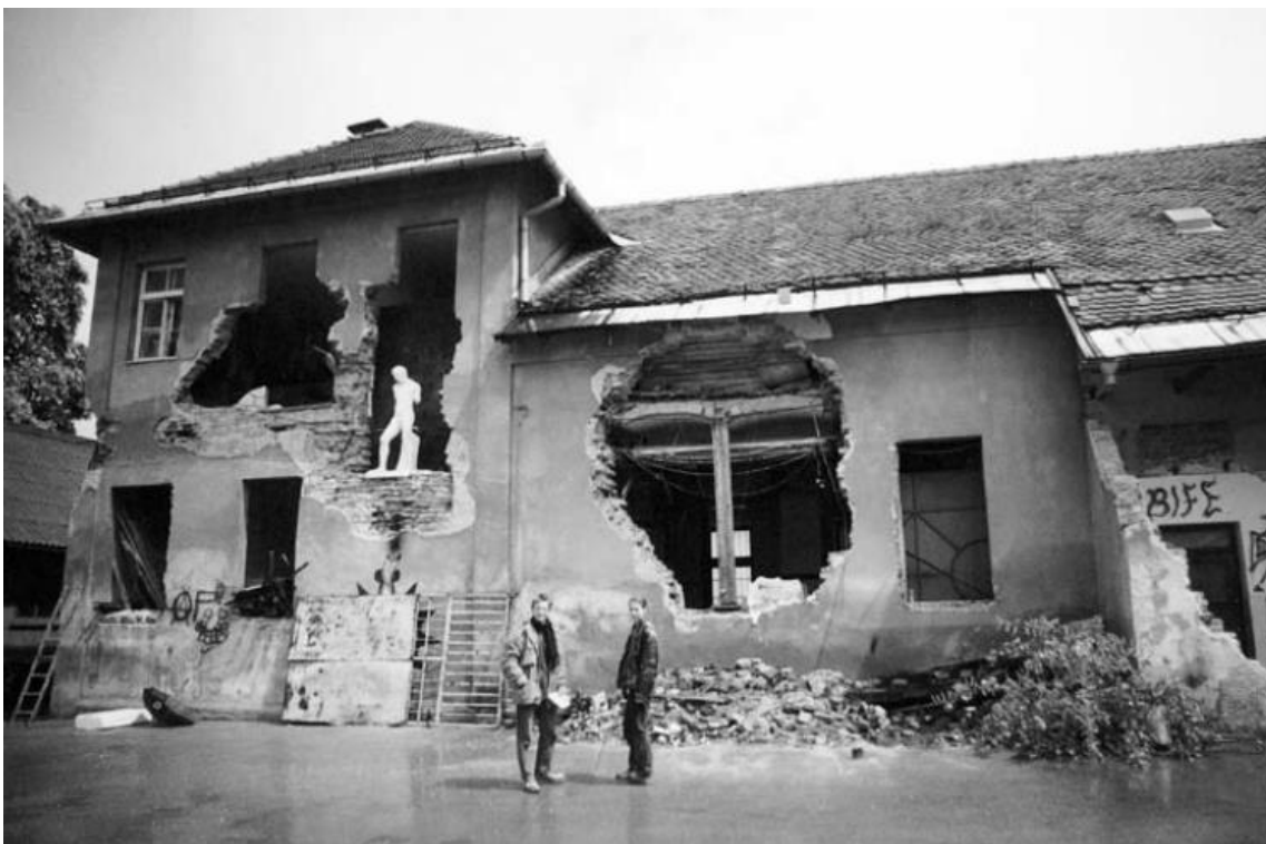
Rys. 3 Hlev, 1996 r.