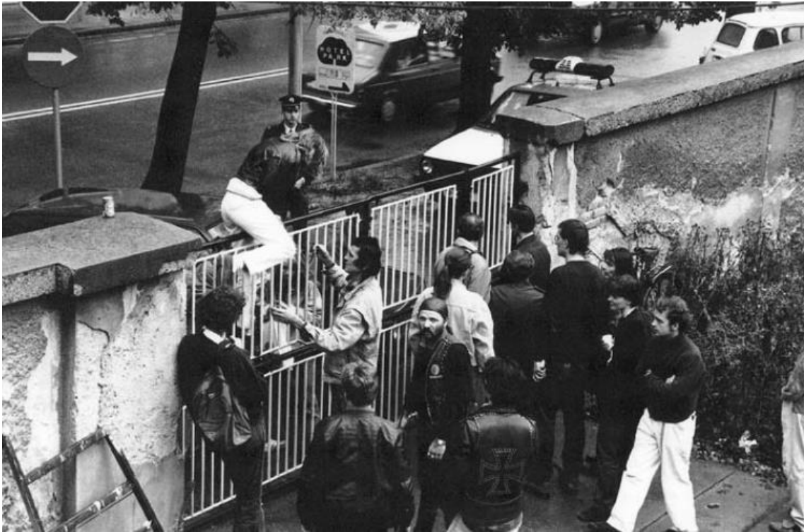
Rys. 2 Metelkova kilka dni po zajęciu.