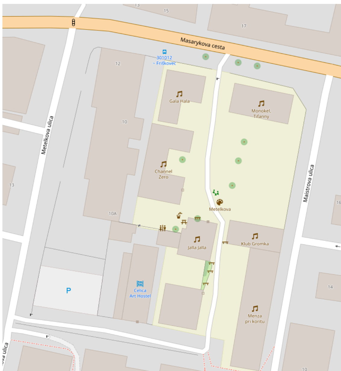
Rys. 5 Metelkova mesto na mapie.