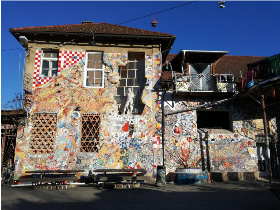
Rys. 4 Hlev, 2017 r.