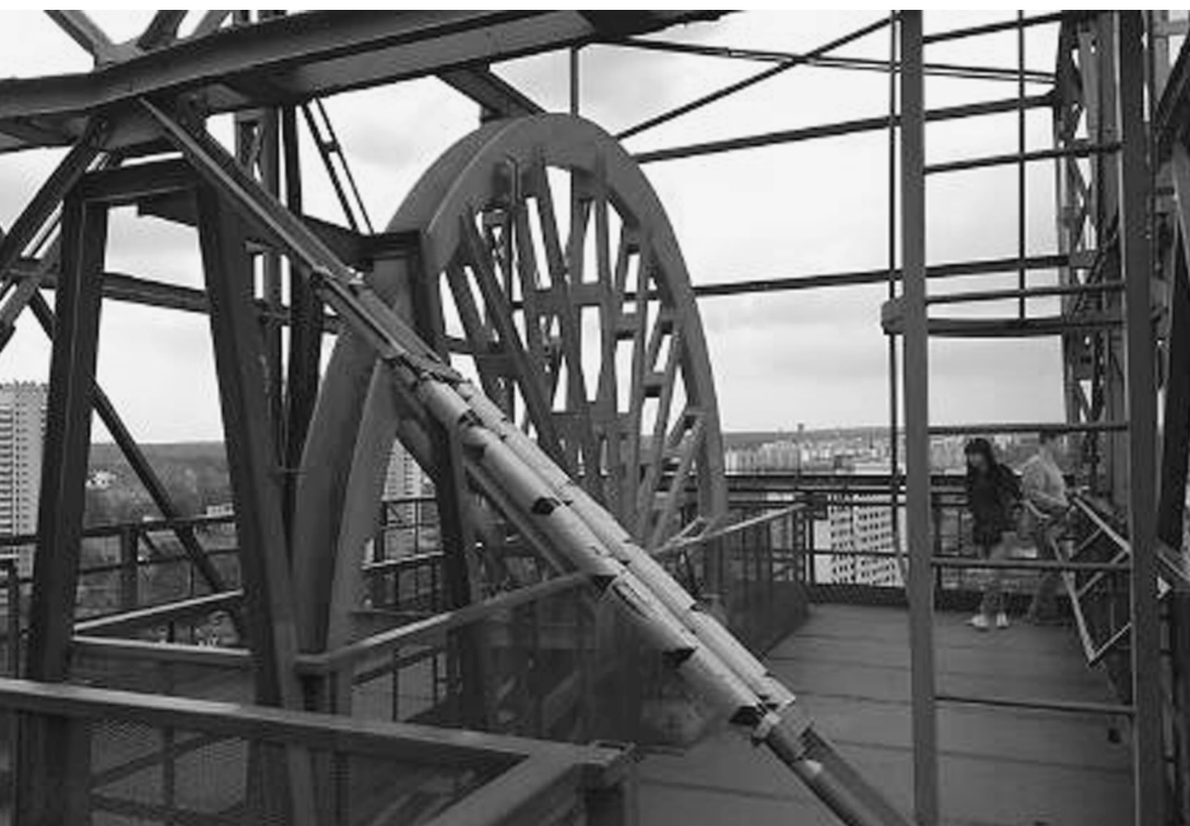
Fot. 8. Szyb Warszawa II dawnej kopalni Katowice, obecnie Muzeum Śląskie w Katowicach 2016 (A. Kunce)