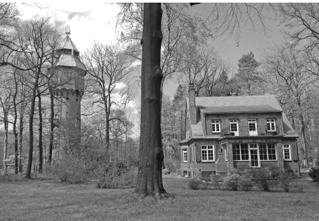
Fot. 5. Giszowiec 2017 (A. Kunce)