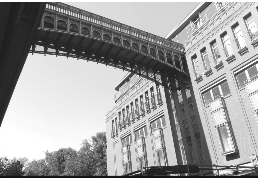
Fot. 17. Stary Browar, Poznań 2016