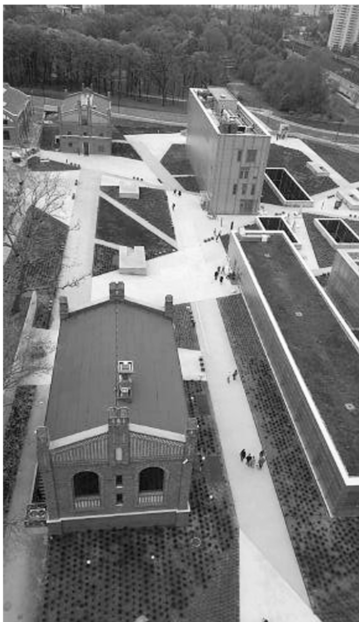
Fot. 7. Muzeum Śląskie w Katowicach na terenach dawnej kopalni Katowice 2017 (A. Kuncze)