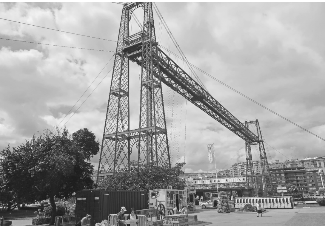
Fot. 4. Bilbao 2017 (A. Kuncce)