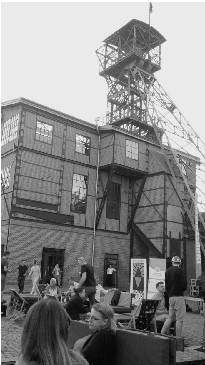
Fot. 18. Szyb Maciej, Zabrze 2017 (A. Kuncce)