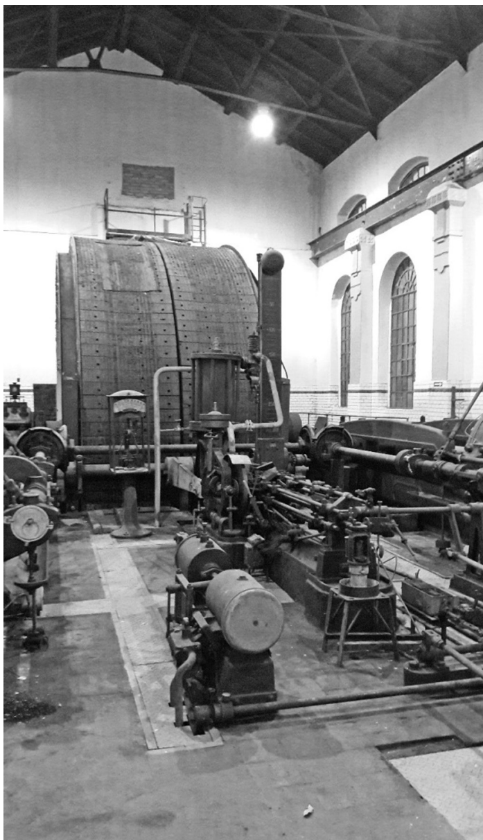
Fot. 10. Muzeum Śląskie w Katowicach na terenach dawnej kopalni Katowice 2017 (A. Kunce)