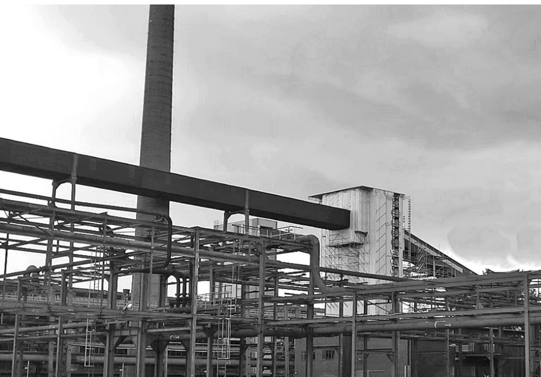
Fot. 16. Ruhr Museum UNESCO – Welterbe Zollverein, Essen 2016 (A. Kuncce)