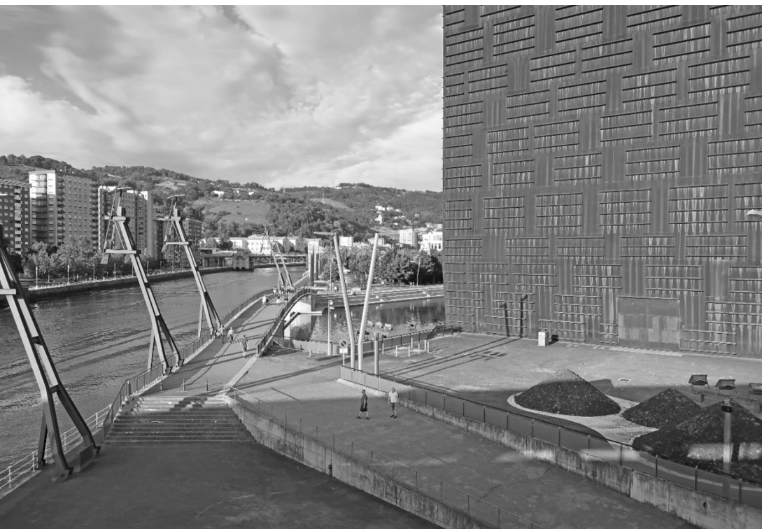
Fot. 3. Bilbao 2017 (A. Kuncic)