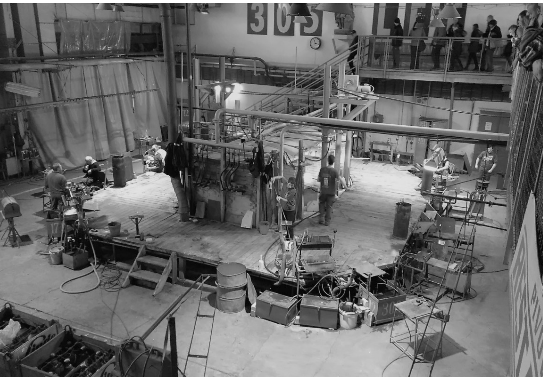
Fot. 19. Sklárna Harrachov (obecne Sklárna a minipivovar Novosad & syn Harrachov), Harrachov 2017 (A. Kunce)