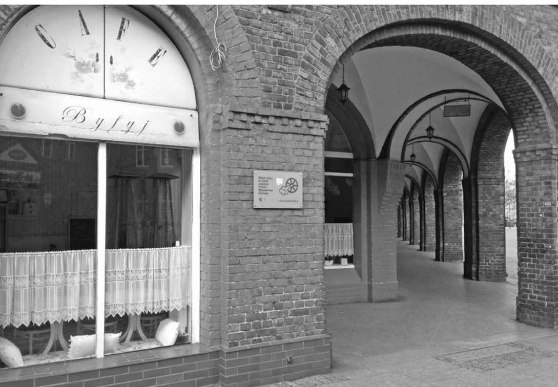
Fot. 12. Nikiszowiec 2017