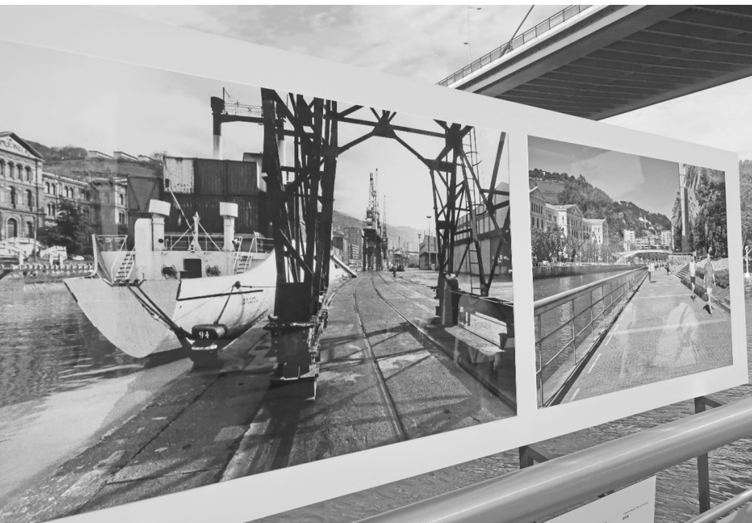
Fot. 1. Bilbao 2017 (A. Kuncce)