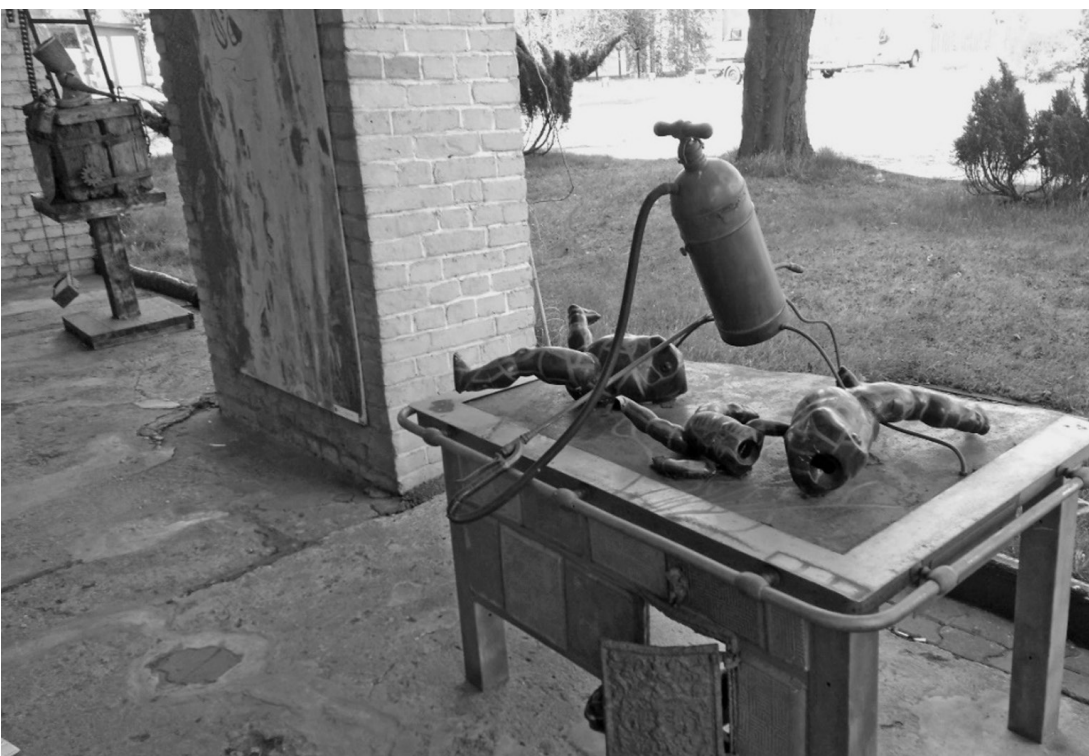
Fot. 14. Szyb Wilson, Katowice 2017 (A. Kunce)