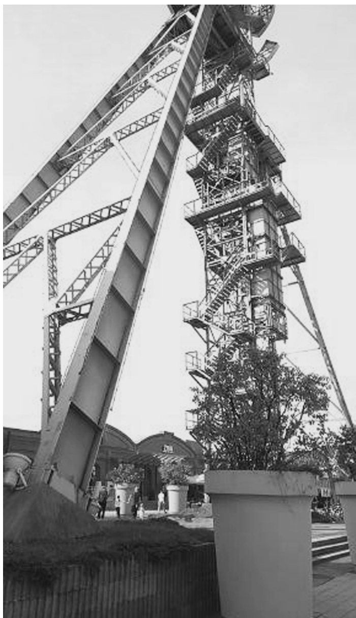
Fot. 11. Centrum handlowe na terenach kopalni Gottwald, Katowice 2016