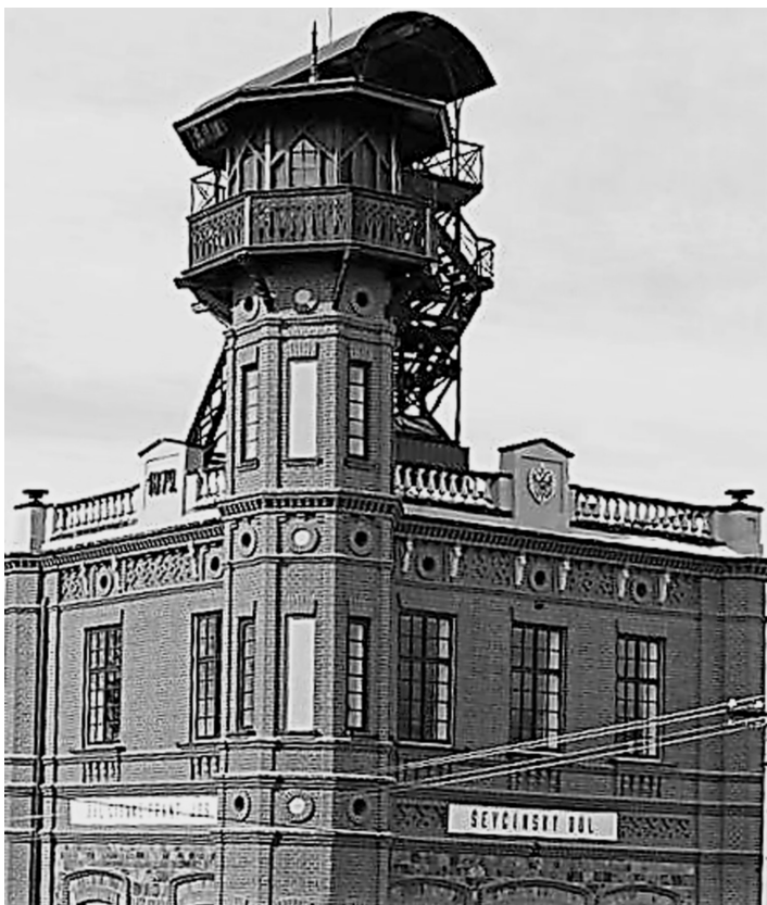
Fot. 6. Hornické muzeum Příbram 2016 (A. Kunc)