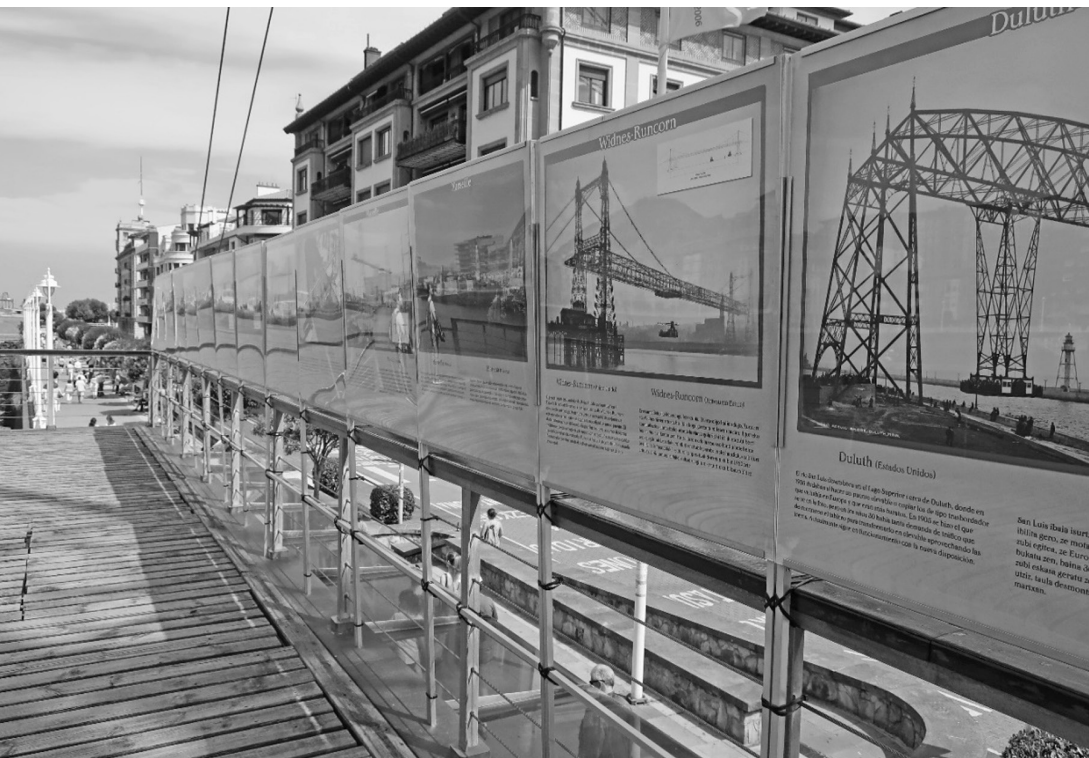
Fot. 2. Bilbao 2017 (A. Kuncce)