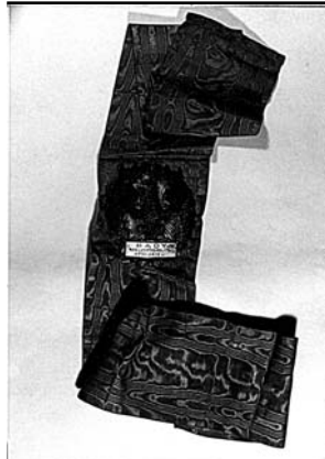
Odnaka sędziego RP Juliana Zagórowskiego na szarfie. Zabytek ze zbiorów Muzeum Górnictwa Węglowego w Zabrze.

stria), którą ukończył w semestrze letnim 1913 5 . W dniu 9 V 1914 r. osiągnął dyplom doktora praw na Uniwersytecie w Grazu. Jego promotorem był Anton Rintelen 6 , profesor prawa cywilnego procesowego 7 . Podczas studiów w Grazu Zagórowski znalazł możliwość utrzymania się u swego stryja, inżyniera hutnika, wówczas dyrektora Fabryki Wagonów.