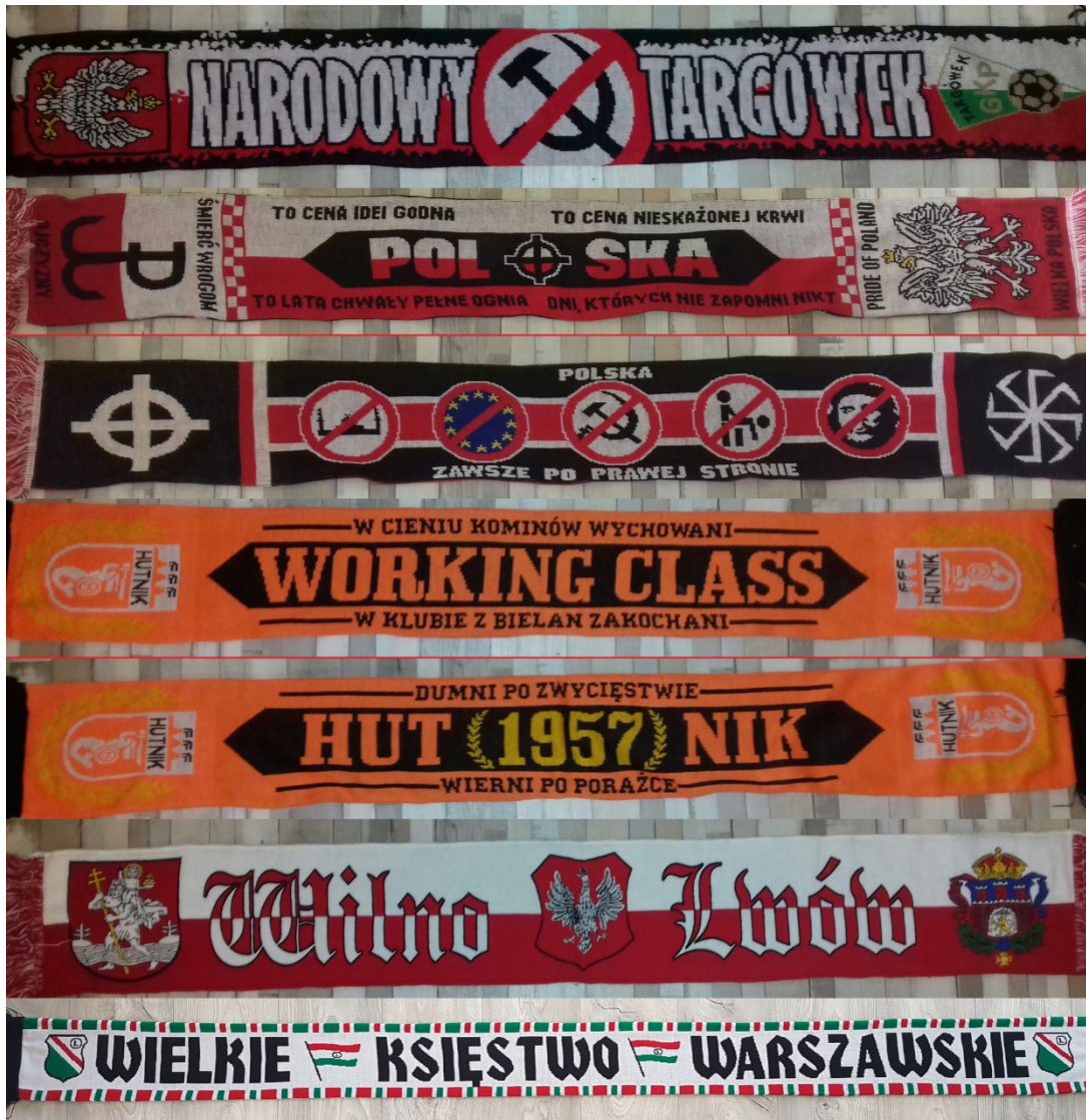
Fot.3 Szaliki z elementami narodowymi i o lokalnym charakterze.

nawołujące do rewizjonizmu polskich granic czy odwołujące się do tzw. „małych ojczyzn”. Na poniższej fotografii widać szaliki dzielnicowych klubów Warszawy (Hutnik Warszawa czy GKP Targówek), którego kibice również są kibicami Legii Warszawa.