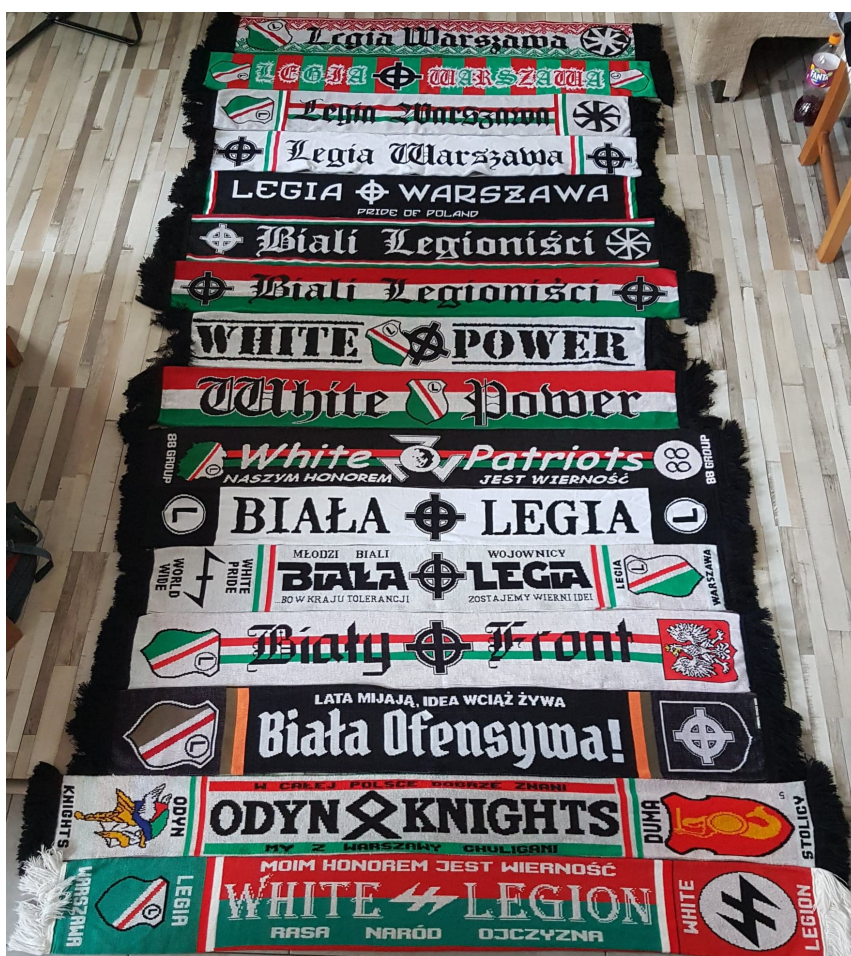
Fot.1 Część kolekcji szalików kibica Legii Warszawa zawierających krzyż celtycki i znaki Waffen SS.

zreszta ludzi o patriotycznych i nacjonalistycznych poglądach usłyszałem kilka różniących się od siebie interpretacji dla krzyża celtyckiego. Dla niektórych członków „jest on wyrazem polskiego nacjonalizmu opartego na idei wiary rzymsko-katolickiej” (Wywiad 2018). Wyrazem są słowa jednego z najwybitniejszych polskich nacjonalistów Romana Dmowskiego „Katolicyzm nie jest dodatkiem do polskości, zabarwieniem jej na pewien sposób, ale tkwi w jej istocie, w znacznej mierze stanowi jej istotę. Usiłowanie oddzielenia u nas katolicyzmu od polskości, oderwania narodu od religii i od Kościoła, jest niszczeniem samej istoty narodu” (Dmowski 1993). W przypadku kibiców Legii Warszawa krzyż celtycki stanowi bardziej odwołanie do rasizmu oraz białej nacji, czego wyrazem może być kolekcja szalików ukazanych na zdjęciu poniżej.