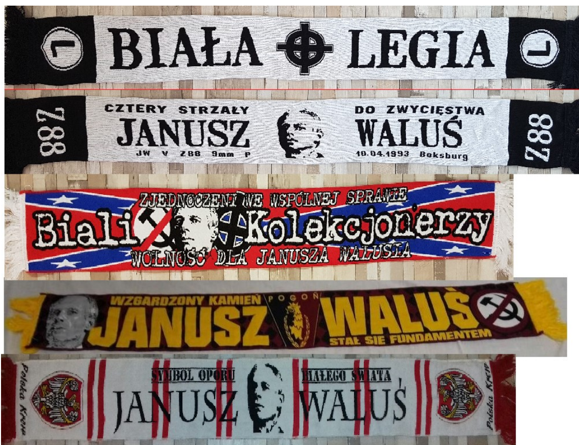
Fot.2. Szaliki z wizerunkiem Janusza Walusia.