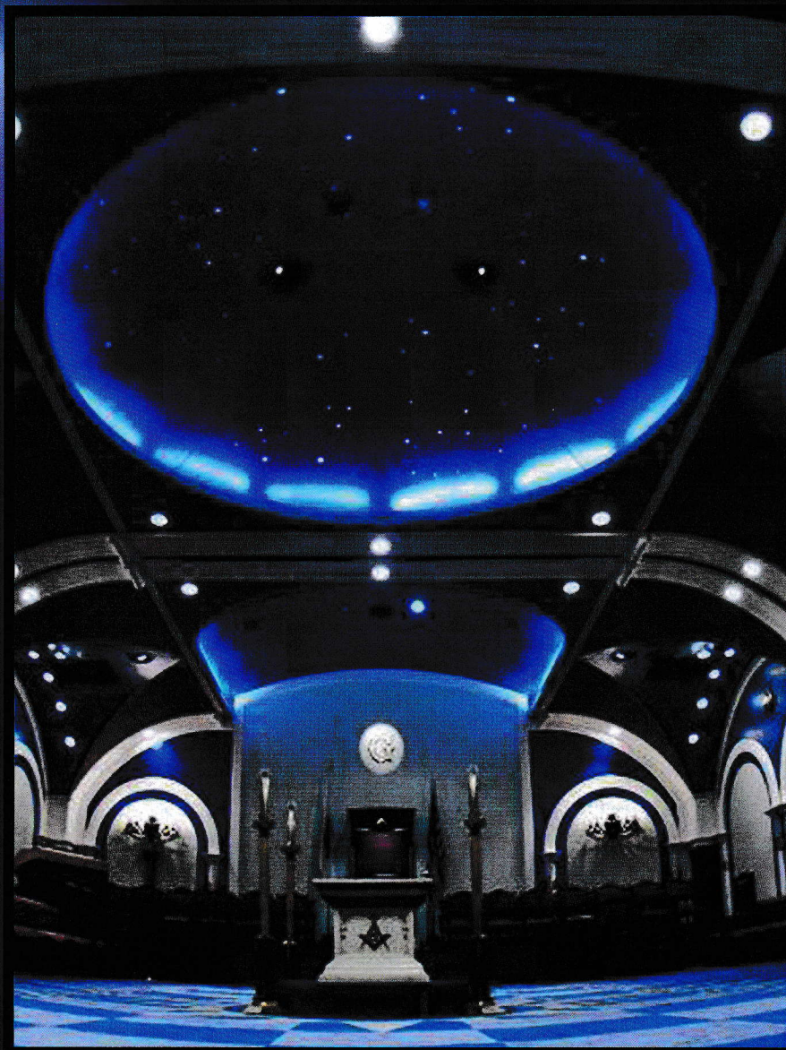
Most Worshipful Grand Lodge of Japan