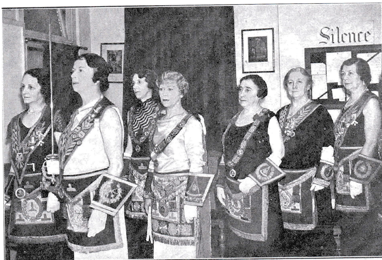
Brytyjskie masonki w trakcie ceremonii