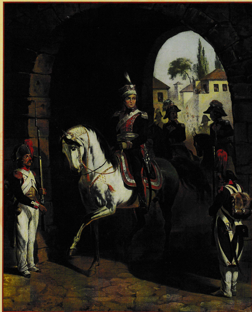
January Suchodolski, Wjazd gen. Jana Henryka Dąbrowskiego do Rzymu