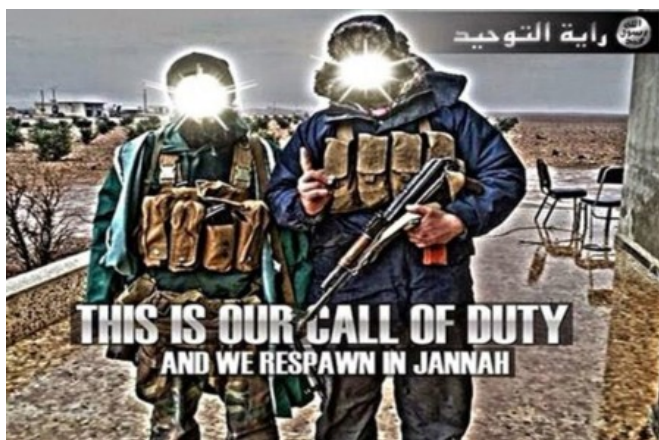
Ilustracja 1. Najsłynniejszy mem rekrutacyjny ISIS

w swej konwencji postów z obrazami z bronią (AK-47), w wojskowym ubraniu, nieraz wprost z pola walki, zaspokajała narcystyczne pragnienia niejednej młodej osoby. Była przedmiotem zazdrości u odbiorców i stymulowała napływ nowych ochotników do Syrii. Najbardziej popularny mem rekrutacyjny rozpowszechniany przez sympatyków ISIS nawiązywał do kultury gier cyfrowych (zob. ilustracja 1).