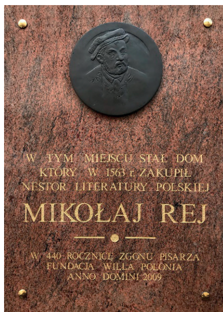
II. 3. Tablica upamiętniająca Mikołaja Reja w Lublinie, ul. Krakowskie Przedmieście

Miejsce pamięci (tu) zdaje się łączyć przeszłość (wcześniej) z teraźniejszością (teraz) oraz pokolenie współczesne (my) z przodkami (oni). Zobrazujmy to przykładem tablicy pamiątkowej z Lublina: