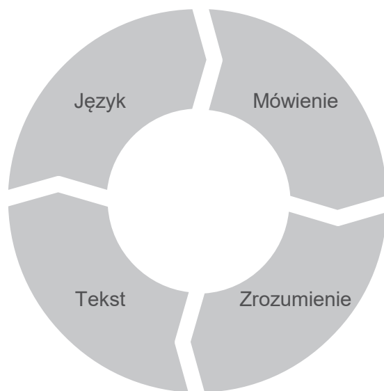
II. 1. Cztery fazy mowy według T. Milewskiego

Swoje ustalenia wizualizuje zaś w następujący sposób: