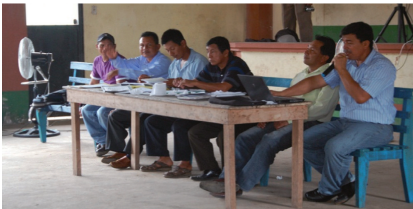
Imagen 3. Reunión de la comunidad para elecciones de autoridades Locales (el Centro de Limoncocha, 17 diciembre, 2011)

La nueva política del gobierno está disminuyendo el tradicional sentido de propiedad y espíritu comunitario. Hay una legalización de la propiedad de la tierra, y la gente recibe escrituras de propiedad; esto contrasta con la cultura comunitaria, donde un sentimiento común que domina es que la tierra pertenece a todos (imagen 3). El formalizar la propiedad