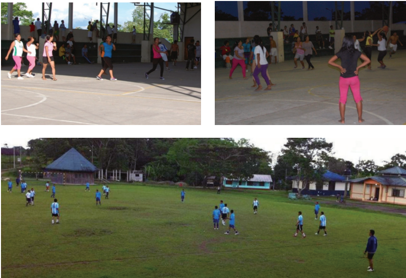
Image 1. Sport activity in Limoncocha. Above: Women playing basketball (center of Limoncocha, January 2012). Below: Men playing football (center of Limoncocha, April 2012)

refer themselves. It creates a deep connection between the individual and the community. Any cultural and economic issue is focused and considered with reference to the community – not to the individual. Community becomes the real space of activity and carries out the essential role in defining and shaping its members' identities. By the term of “communitarian spirit” we mean a specific atmosphere which may be observed in public space, in decision-making situations, and in everyday activities – a spirit that indicates an emotional attachment to one's own community and placing the community in the foreground.