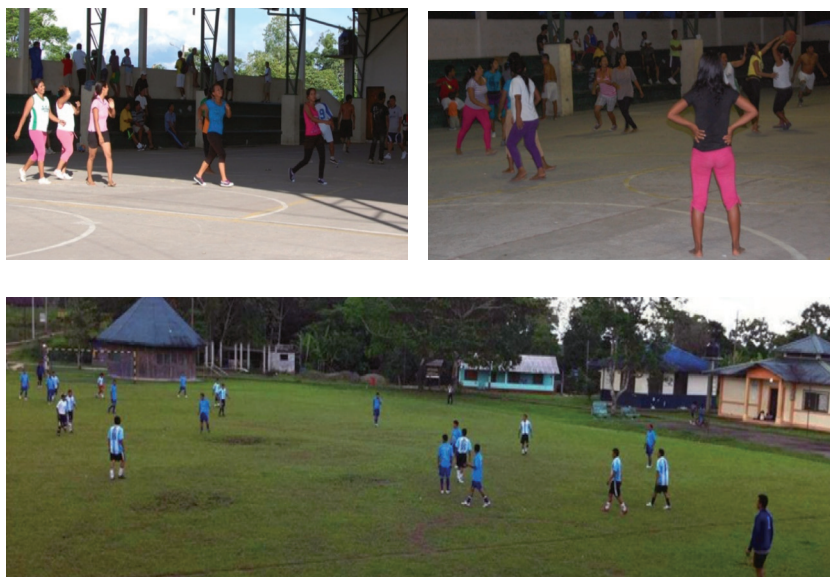
Imagen 1. Actividad deportiva en Limoncocha Arriba: Mujeres jugando al baloncesto (centro de Limoncocha, enero 2012). Abajo: Hombres jugando fútbol (centro de Limoncocha, abril 2012)

El comunitarismo es una forma de organización social que hace énfasis en la comunidad como la entidad social básica a la cual los individuos deben remitirse; genera una profunda conexión entre el individuo y la comunidad. Cualquier asunto cultural y económico se enfoca y se considera en referencia con la comunidad – no con el individuo. La comunidad se convierte en el espacio real de actividad y cumple con el rol esencial de definir y dar forma a las identidades de sus miembros. Con el término “espíritu comunitario” nos referimos a una atmósfera específica que puede observarse en el espacio público, en situaciones de toma de decisiones, y en actividades diarias – un espíritu que indica una relación emocional con la comunidad de uno mismo, y ubica a la comunidad en primer plano.