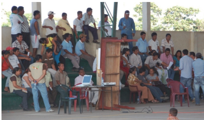
Imagen 2. Reunión de la comunidad discutiendo el asunto del futuro de Limoncocha (considerando el plan de desarrollo de Shushufindi, el asunto de preparación del proyecto, y la prohibición ministerial de la pesca en la Laguna) con los representantes de la Municipalidad de la parroquia de Shushufindi (el Centro de Limoncocha, 9 de diciembre de 2011).

Una consecuencia de la manera de pensar comunitaria es la aprobación de la inequidad en la distribución de la riqueza en la comunidad. Algunos de sus miembros (especialmente las autoridades locales o el jefe de la comunidad y su familia) usan autos caros u otros equipos de lujo recibidos por la comunidad como regalos de las compañías petroleras. Los habitantes no ven esto como una distribución inequitativa, porque ellos saben que esta es propiedad que pertenece a la comunidad como un todo y no a un miembro particular.