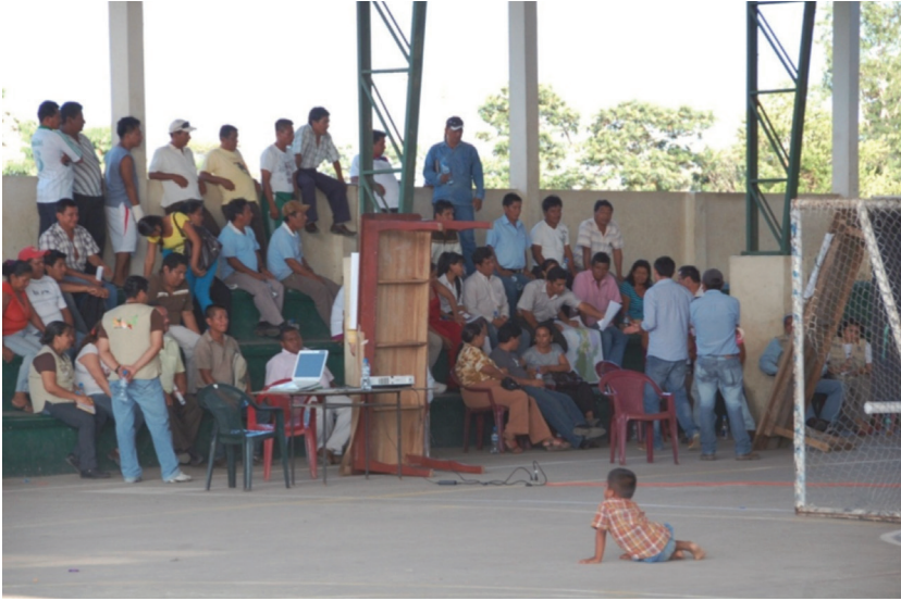
Image 2. Community meeting discussing the issue of Limoncocha's future (considering the development plan of Shushufindi, the issue of project preparations, and the ministerial ban forbidding fishing in the Lagoon) with representatives from the Municipality of Shushufindi Parish (the Centre of Limoncocha, 9 December 2011)

Another indicator of communitarian attitude could be the opinion expressed by community members about the scholarships for the best students. In Limoncocha only a few students have received grants or scholarships financed by the government. However, many other students would like to study but they have no chance to receive money for it. In the opinion of Limoncocha inhabitants the money should be distributed for all the candidates who want to study. Moreover, if somebody graduates from the University he or she should thank community for the chance for receiving the diploma. If graduates do not do this they are accused of ingratitude.