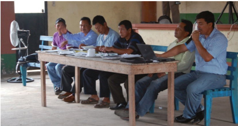
Image 3. Community meeting on local authority elections (the Centre of Limoncocha, 17 December 2011)

The new policy of government is diminishing the traditional sense of ownership and communitarian spirit. There is a legalization of the land ownership, and people receive property deeds. This is in contrast to the communitarian culture, where a common feeling dominates that the land belongs to everybody (image 3). Formalizing the ownership and giving the land to an individual is a foreign custom dictated on the people of Limoncocha: