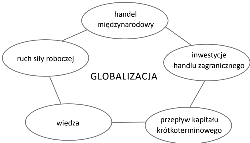
Rysunek 2. Elementy globalizacji

Źródło: J. E. Stiglitz, Globalization and growth in emerging markets , „Journal of Policy Modeling” 2004, no 26, s. 470.