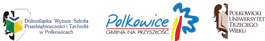
Rysunek 1. Logotypy: Dolnośląskiej Wyższej Szkoły Przedsiębiorczości i Techniki w Polkowicach, Polkowic oraz Polkowickiego Uniwersytetu Trzeciego Wieku.