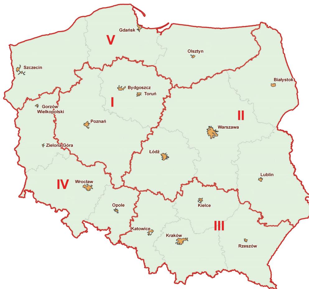
Mapa A.1. Makroregiony badawcze Zakładu Polityki Społecznej i Regionalnej IERiGŻ-PIB

* Poszczególnym makroregionom odpowiadają następujące oznaczenia i województwa: środkowozachodni (I) – kujawsko-pomorskie i wielkopolskie; środkowowschodni (II) – mazowieckie, lubelskie, łódzkie i podlaskie; południowo-wschodni (III) – małopolskie, podkarpackie, śląskie i świętokrzyskie; południowo-zachodni (IV) – dolnośląskie, lubuskie i opolskie; północny (V) – pomorskie, warmińsko-mazurskie i zachodniopomorskie.