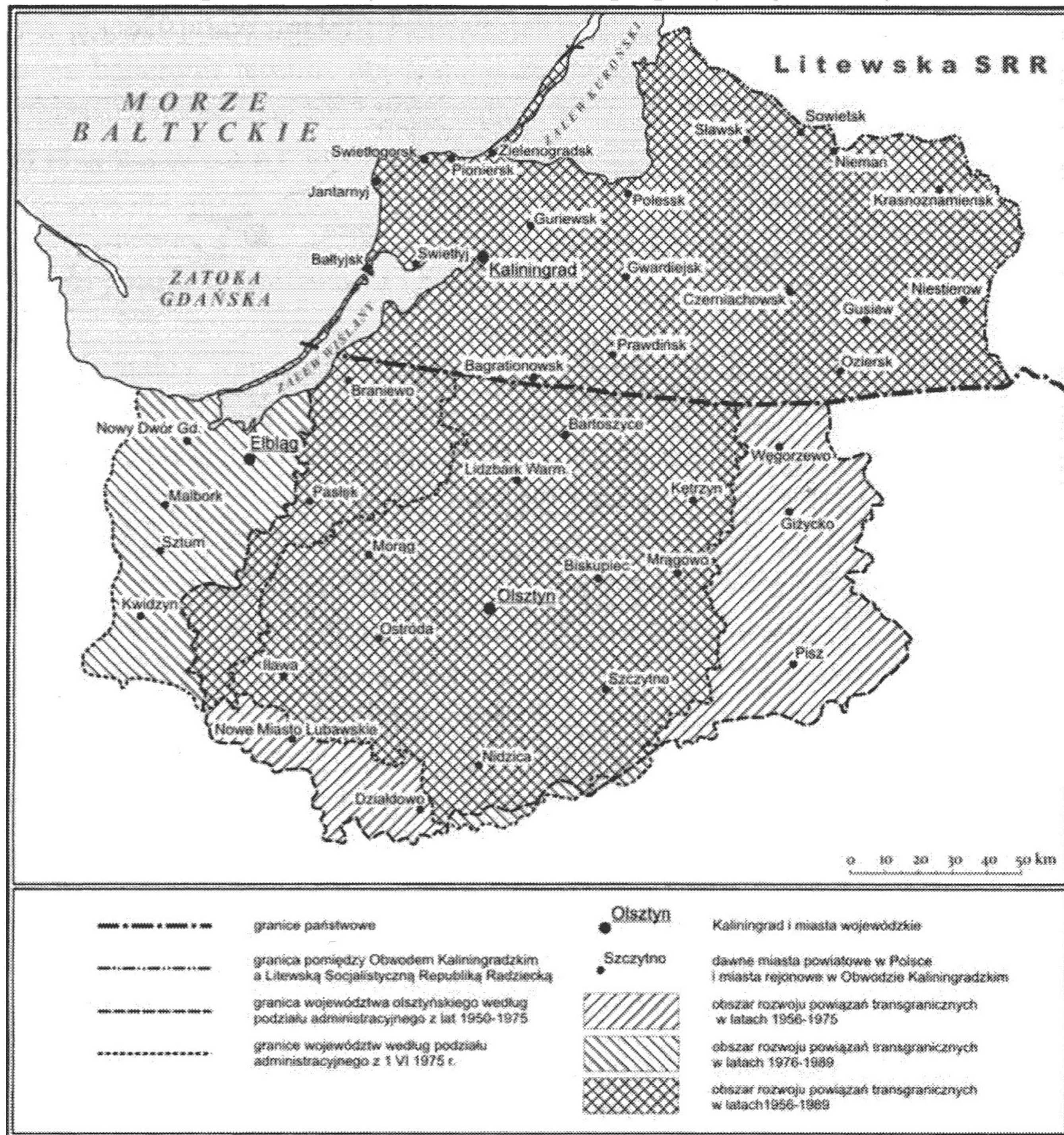
Ryc. 1. Obszary rozwoju współpracy transgranicznej z Obwodem Kaliningradzkim w latach 1956-1989. Źródło: opracowanie własne.

cechowała przygraniczny powiat bartoszycki i rejon bagrationowski. Poza kształtowanymi pomiędzy nimi wybranymi powiązaniem na poziomie lokalnym, ich terytoria stanowiły miejsce spotkań (głównie na granicy) różnych delegacji i grup oraz organizowania imprez masowych w ramach współpracy regionalnej.