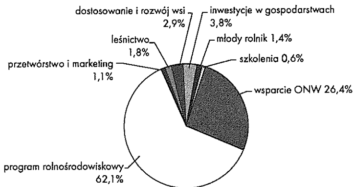
Rys. 2. Rozdysponowanie środków finansowych na rozwój rolnictwa austriackiego wg poszczególnych działań.

W latach 2000-2006 na Plan Rozwoju Obszarów Wiejskich w Austrii przeznaczono w sumie 7 mld EUR. Do końca 2004 roku wypłacono 4,85 mld EUR, co stanowiło trzy czwarte gwarantowanego budżetu. Największa część tej kwoty – 62,1% przeznaczona została na działania rolnośrodowiskowe – ÖPUL 3 oraz wsparcie obszarów o niekorzystnych warunkach gospodarowania – 26,4%. Tak wysoki odsetek środków przeznaczonych na program rolnośrodowiskowy i ONW wynika z przyjętej strategii polityki rolnej Austrii, która ma na celu niedopuszczenie do zaniechania produkcji na obszarach o trudnych warunkach gospodarowania, a także objęcie wsparciem finansowym jak największej liczby rolników w ramach działań rolnośrodowiskowych. Udział pozostałych przedsięwzięć był o wiele niższy. Rysunek 2 przedstawia strukturę podziału środków finansowych w ramach PROW.