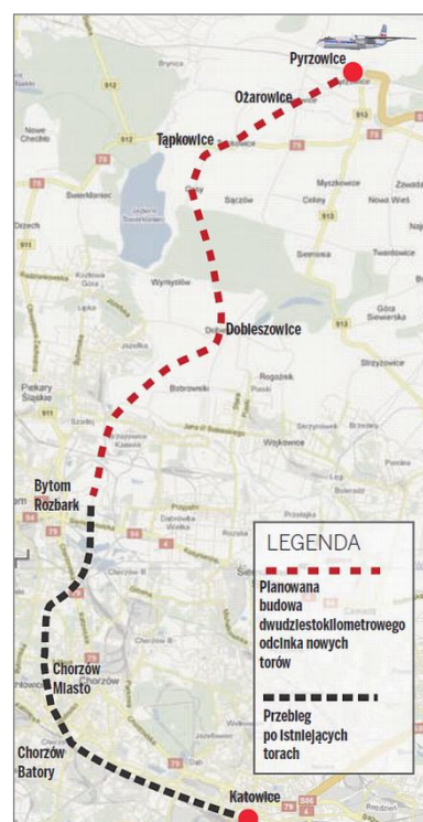
Rys. 3. Przebieg linii kolejowej do portu lotniczego Katowice Pyrzowice

Włączenie nowo wybudowanej linii kolejowej w istniejący układ komunikacyjny wpłynie także na poprawę