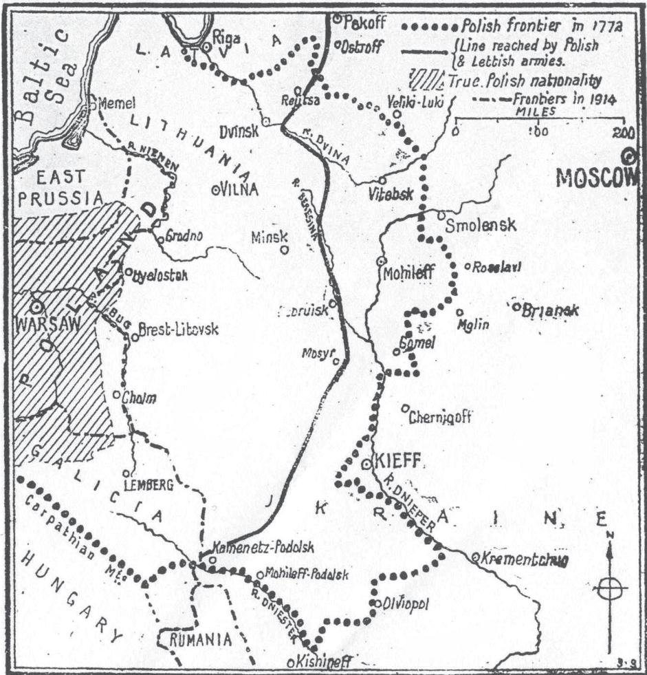
1. Mapa zamieszczona w „The Manchester Guardian” w czasie wojny polsko-radzieckiej 1920 r. przedrukowana w ulotce National „Hands of Russia” Committee.