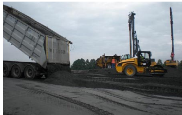
Rys. 6. Wykorzystanie kruszyw alternatywnych: A) z żużli pohutniczych do budowy autostrady A4(11), B) z żużli paleniskowych do budowy nasypu pod lokalizację hali (19)

premiowaniu (ulgi, dotacje) innych kierunków wykorzystania). Przy czym należy pamiętać, że kruszywa pogórnice oraz z recyklingu, w stosunku do kruszyw pohutniczych, charakteryzują się gorszymi parametrami użytkowymi, a więc w pełni nie zastępują kruszyw pohutniczych.