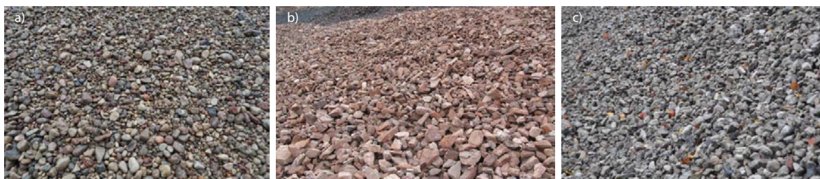
Rys. 1. Rodzaje kruszyw: a) naturalne (żwir), b) sztuczne (łupek przepalony) c) z recyklingu (przekruszony beton)

„ekonomicznymi” należy wyróżnić również korzyści środowiskowe oraz społeczne.