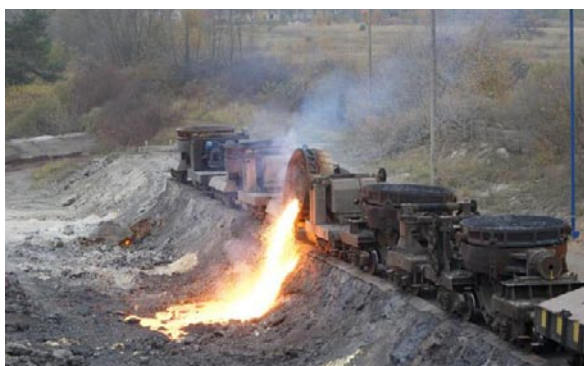
Rys. 4. Rozładunek kadzi z płynnym żużlem (10)