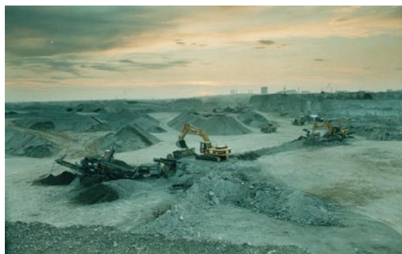
Rys. 5. Eksploatacja hałdy żużli pohutniczych w Krakowie

Miejsca produkcji kruszyw z recyklingu należy powiązać głównie z dużymi aglomeracjami miejskimi, gdzie koncentruje się większość rozbiórkowych robót budowlanych.