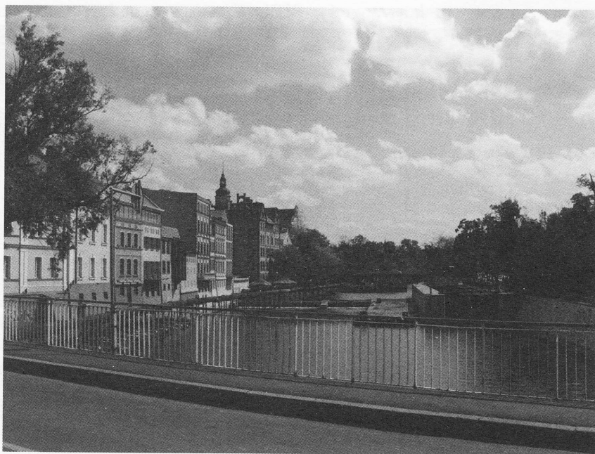
Opolska „Wenecja”.