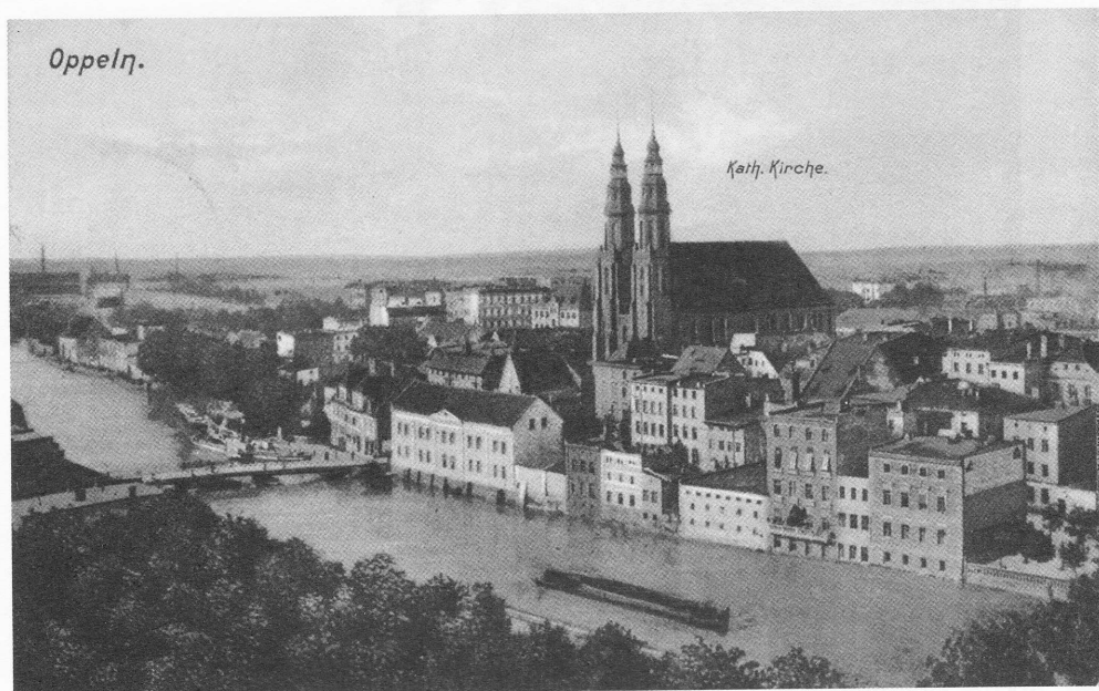
Opole – pocztówka z 1915 r.