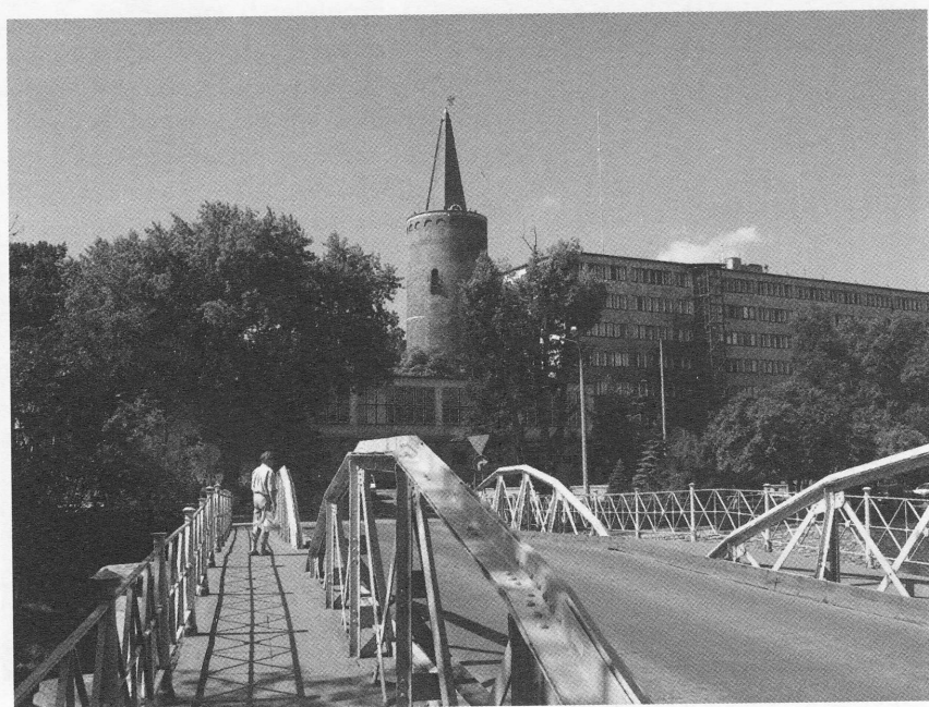
Opole – widok na Pasiekę.