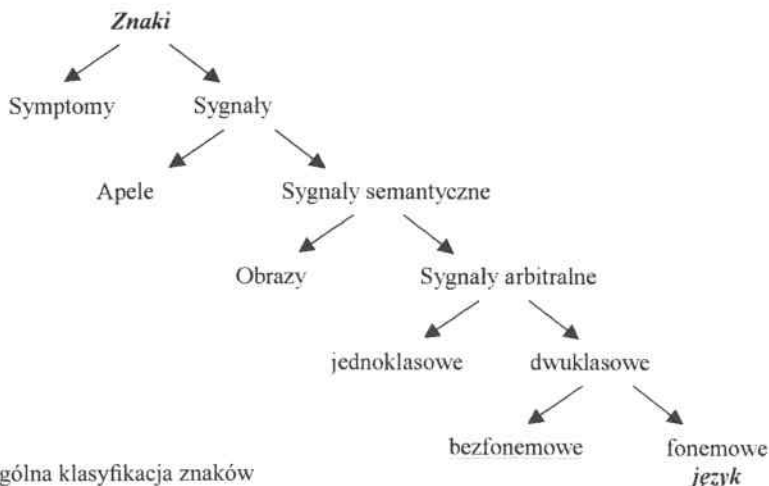
Rys. 3. Ogólna klasyfikacja znaków (M i l e w s k i, 1993, s. 13)

Ogólną klasyfikację znaków, opartą na ich funkcjach i strukturze, przedstawił T. M i l e w s k i (1993, s. 9–13):