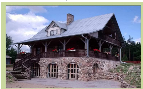
Фотография 2. Экологическое хозяйство Силяине

это единственный агротуристический объект в котором были все виды зверей, птиц и меховых зверей. В хозяйстве сервировали здоровую пищу, свойскую еду вместе с хлебом с собственной выпечки, свойским маслом и другими продуктами. Достоинство фермы - функционирование хозяйства в поддержке семейной модели.