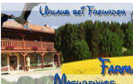
Фотография 1. Мазурская

В оценке исследуемых самое высокое место заняла Мазурская Ферма (62,15%) (Фотография 1). На ферме выступают все типичные виды хозяйственных зверей, напр. 6 коней, стадо выращенного скота, овцы, козы, меховые звери, дрови выращиваемые методом свободной уловки. Познавательную функцию выполняет возможность приготовления и выпечки хлеба, игрушек теста, осматривания и подкармливания зверей и т.п. Был