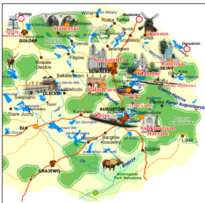
Карта 1. Сувальщизна Страна Сказка (СА) и Страна Охотников Приключений (ЭГО)

Характеристика исследуемых. Исследования переведено среди 22 гостей туристических объектов: студенты и участники практических занятий (апрель-июнь 2012): туризм и отдых; сельское хозяйство специальность агротуризм (86,36 %). Остальные (13,64 %) были работниками туристической отрасли и участниками учебных визитов (в годах 2010–2012) в пределах проектов: Сувальщизна Страна Сказка (СА) и Страна Охотников Приключений (ЭГО) (карта 1).