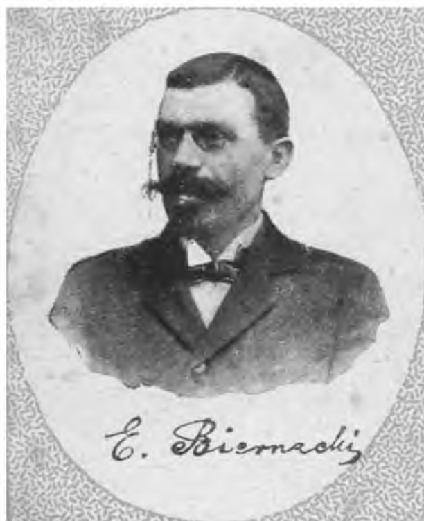
RYC. 1. Edmund Biernacki