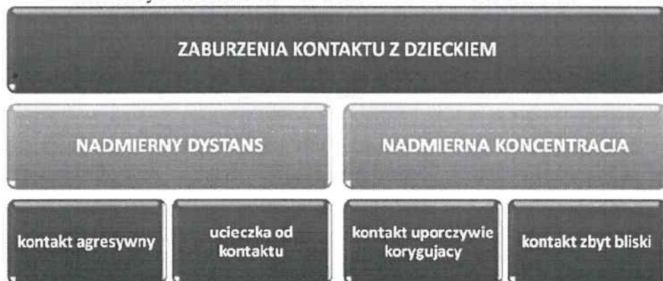
Schemat 2. Formy zaburzeń kontaktu rodziców z dzieckiem

Ziemska (Ziemska 1973: 50–69) scharakteryzowała główne typy postaw wymagających modyfikacji lub podtrzymania, rozwinięcia i wzmocnienia, ponieważ określają one warunki prawidłowego rozwoju osobowości dziecka. Podstawę niewłaściwych postaw rodzicielskich stanowi nadmierny dystans uczuciowy lub nadmierna koncentracja (por. schemat 2).