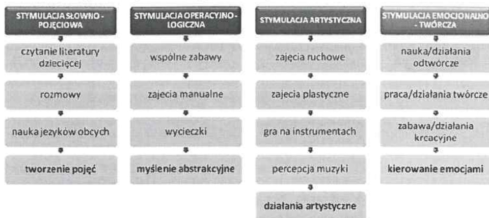
Schemat 5. Stymulatory działań wychowawczych rodziców