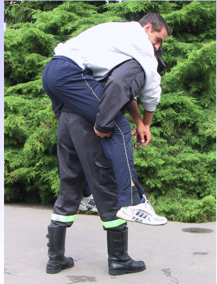
Chwyt „na barana”