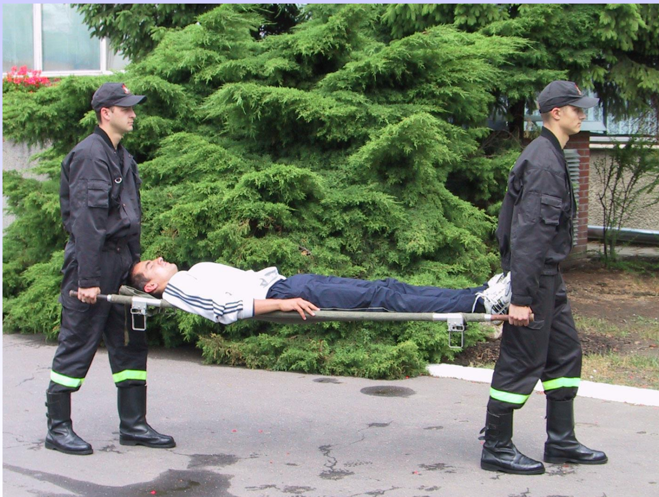
Transport za pomocą noszy