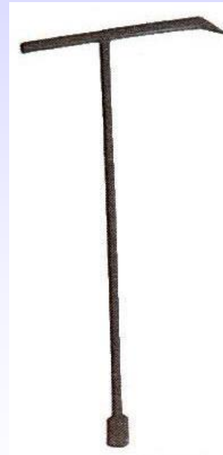
Klucz do stojaka hydrantowego