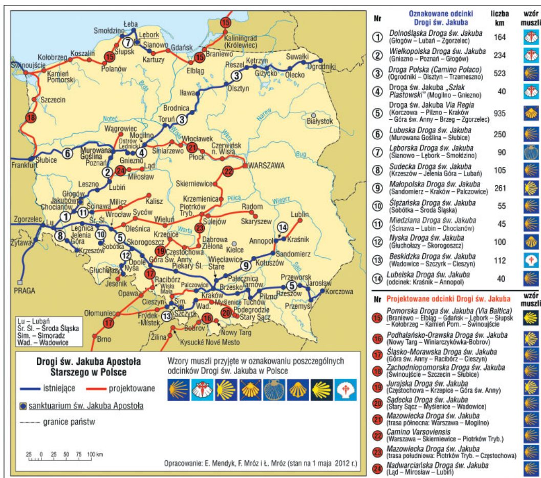
Mapa XXIX. Drogi św. Jakuba w Polsce (Cesty sv. Jakuba v Poľsku)