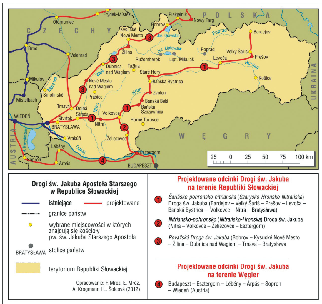
Mapa XXXI. Drogi św. Jakuba w Słowacji i na Węgrzech ( Cesty sv. Jakuba na Slovensku a v Maďarsku )