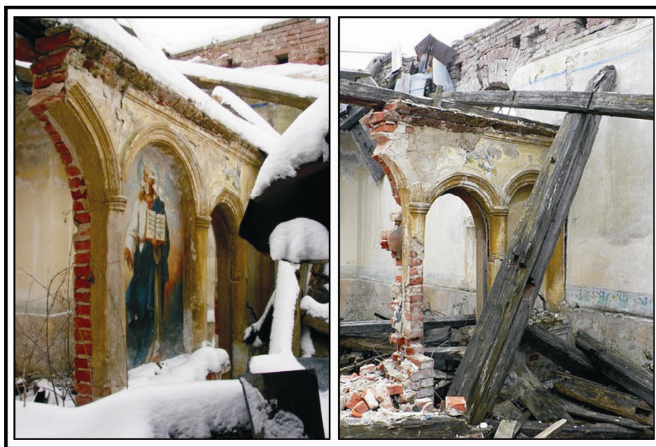
Fot. 2. Zrujnowana cerkiew pw. Przemienienia Pańskiego w Ujkowicach (z prawej stan styczeń 2010 r., źródło: http://mapa.nocowanie.pl/ujkowice/zdjecia/ ; z lewej stan kwiecień 2011 r.,) Źródło: fot. Ł. Mróz

Obecnie, niemal wszystkie cerkwie na Pogórze Dynowskim pełnią funkcję kościołów rzymskokatolickich. Tylko dwie świątynie użytkowane są przez wiernych obrządku grekokatolickiego. Jest to cerkiew w Hłomczy oraz w Krasicach (nabożeństwa są tu jednak odprawiane sporadycznie – głównie na wspomnienie św. Michała, patrona cerkwi). Aż 6 obiektów na tym obszarze jest obecnie nieużytkowanych: Bliźnianka, Grabówka, Kramarzówka, Reczpol, Tyniowice i Wara. Natomiast 3 cerkwie są zrujnowane: Babice, Maćkowice i Ujkowice (fot. 2). Należy zwrócić uwagę na stan i zabezpieczenie ww. obiektów oraz zainteresowanie nimi miejscowych samorządów i konserwatora zabytków.