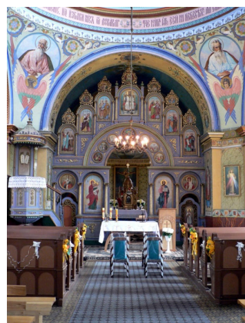
Fot. 3. Ikonostas w kształcie półłuku w cerkwi pw. św. Paraskiewy w Rzepniku – obecnie kościół rzymskokatolicki pw. św. Teresy (parafia Łączki Jagiellońskiej)

Poszczególne obiekty na szlaku udostępnione są do zwiedzania. W większości cerkwi użytkowanych jako kościoły rzymskokatolickie klucze do świątyni znajdują się na plebani lub w prywatnych domach osób opiekujących się danym obiektem. Na folderach oraz innych publikacjach poświęconych szlakom tematycznym omówionych wcześniej znajdują się informacje, kiedy odprawiane są msze św. oraz gdzie można szukać osób, które umożliwią turyście zwiedzanie obiektu wewnątrz. Część wiadomości jest już, niestety, zdezaktualizowana. Ponadto, bezpośrednio przy cerkwiach nie znajdują się