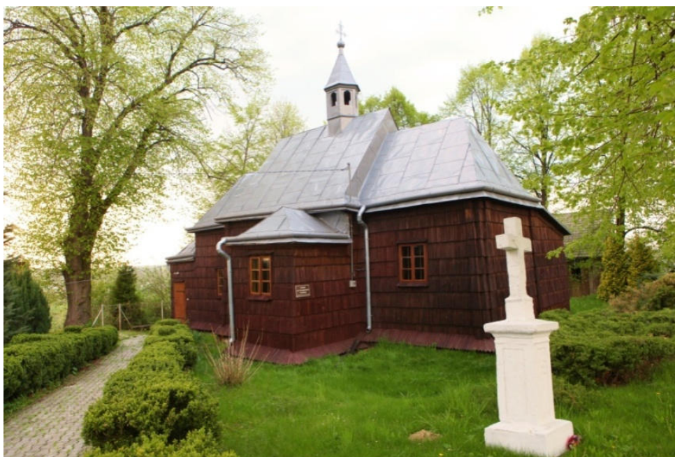
Fot. 1. Cerkwiew pw. Wniebowstąpienia Pańskiego w Hawłowicach – obecnie kościół rzymskokatolicki pw. św. Mikołaja Biskupa (parafia Pruchnik). Cerkwiew zbudowana w 1683 r.

Najstarsza cerkiew na analizowanym terenie znajduje się w Hawłowicach, miejscowości położonej na Podgórzu Rzeszowskim, na północ od Pruchnika (fot. 1). Jest to cerkiew pw. Wniebowstąpienia Pańskiego, wybudowana w II poł. XVII w. (prawdopodobnie w 1683 r.) i gruntownie przebudowana w 1863 r. Przy nawie cerkwi wybudowano dwa niewielkie pomieszczenia, tzw. kryłosa, przeznaczone dawniej dla duchownych i chóru kapłańskiego. Obecnie mieszczą się w nich konfesjonaty. Jest to charakterystyczna część budownictwa cerkiewnego, która występuje w najstarszych cerkwiach. Należy zaznaczyć, że spośród drewnianych cerkwi Karpat Polskich kryłosa występują jeszcze jedynie w cerkwi w Tyliczu 11 .