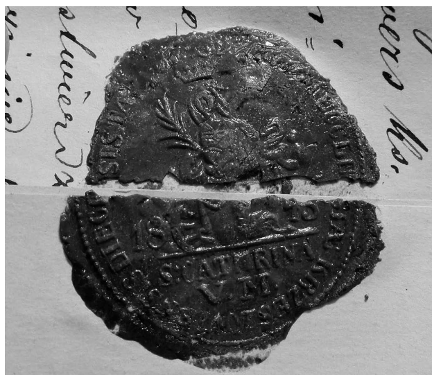
Ryc. 6. Odcisk pieczęci w bordowym laku, dawny kościół pw. św. Katarzyny Aleksandryjskiej w Krzeszowie, AKKM, APA 166 Krzeszów, Korespondencja z Konsystorzem Biskupim w Tarnowie , 12 marca 1879 r.6