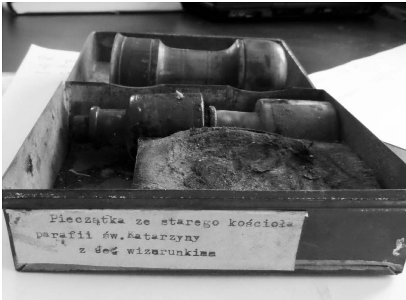
Ryc. 2. Pudełko na stempel tuszowy z dawnego kościoła parafialnego pw. św. Katarzyny Aleksandryjskiej w Krzeszowie