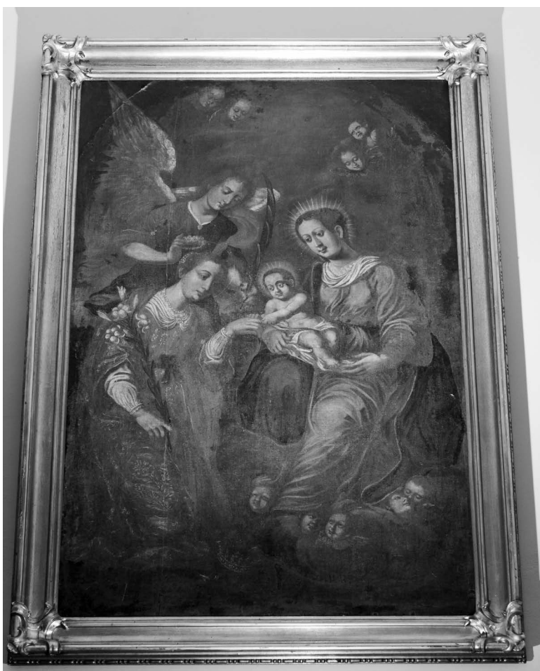
Ryc. 9. Obraz Mistyczne Zaślubiny św. Katarzyny , olej na płótnie, 1663 r., dawny kościół pw. św. Katarzyny Aleksandryjskiej w Krzeszowie