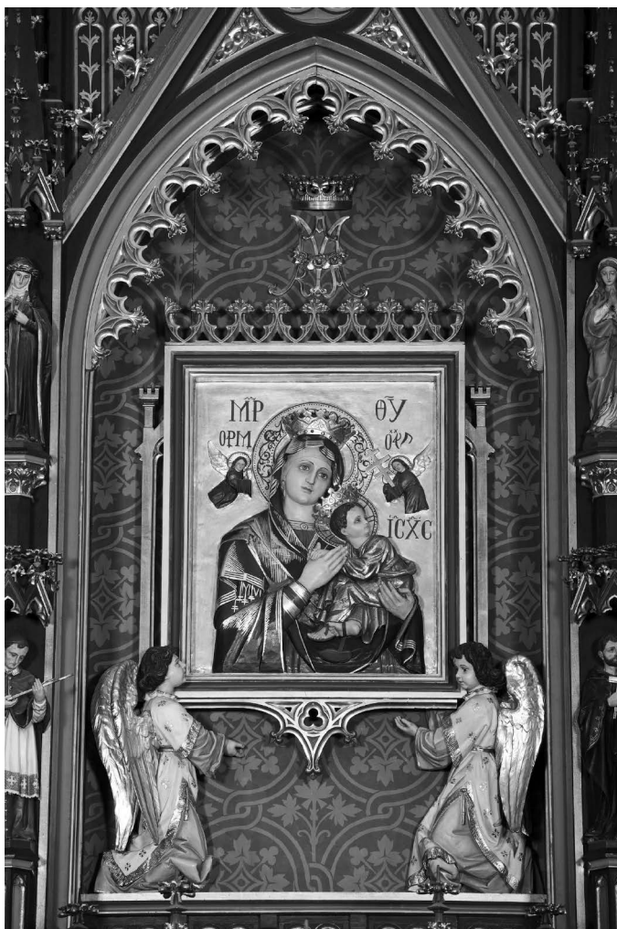
Ryc. 11. Kopia ikony Matki Boskiej Nieustającej Pomocy w ołtarzu głównym w świątyni pw. Matki Boskiej Nieustającej Pomocy w Krzeszowie, po 1903 r.