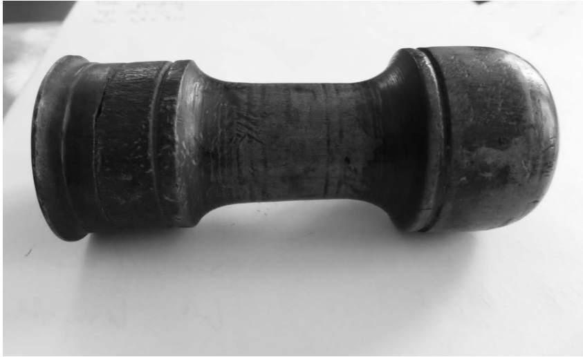
Ryc. 1. Tłok pieczętny z dawnego kościoła pw. św. Katarzyny Aleksandryjskiej w Krzeszowie, widok ogólny (fot. A. Karpacz)