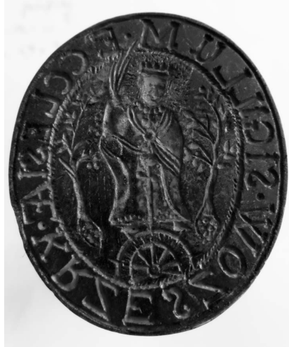
Ryc. 3. Awers tłoka pieczętnego z dawnego kościoła pw. św. Katarzyny Aleksandryjskiej w Krzeszowie