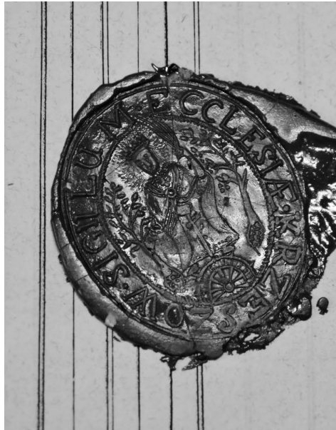
Ryc. 4. Odcisk pieczęci w bordowym laku, dawny kościół pw. św. Katarzyny Aleksandryjskiej w Krzeszowie, AKKM, Copiae Copulatorum Parochiae Krzeszów , 12 stycznia 1886