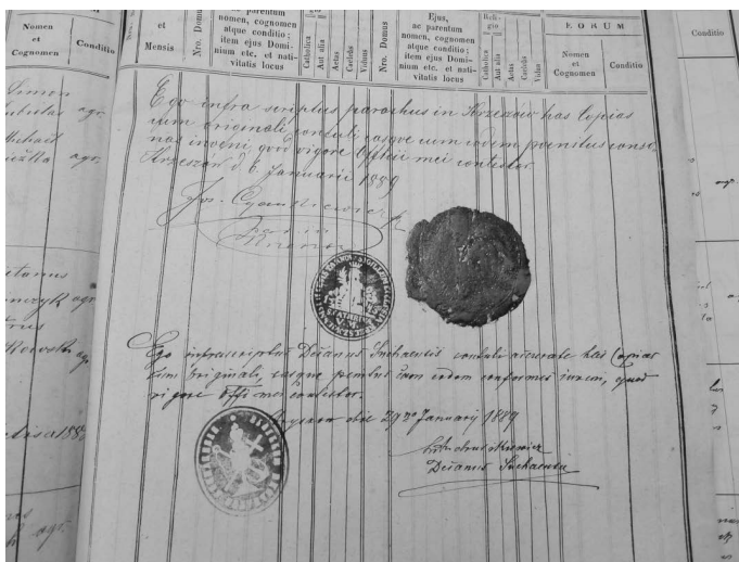
Ryc. 8. Odcisk pieczęci w bordowym laku i granatowym tuszu, dawny kościół pw. św. Katarzyny Aleksandryjskiej w Krzeszowie oraz odcisk pieczęci dekanatu makowskiego w czarnym tuszu, AKKM, Copiae Natorum Parochiae Krzeszów , 29 stycznia 1889 r. (fot. A. Karpacz)