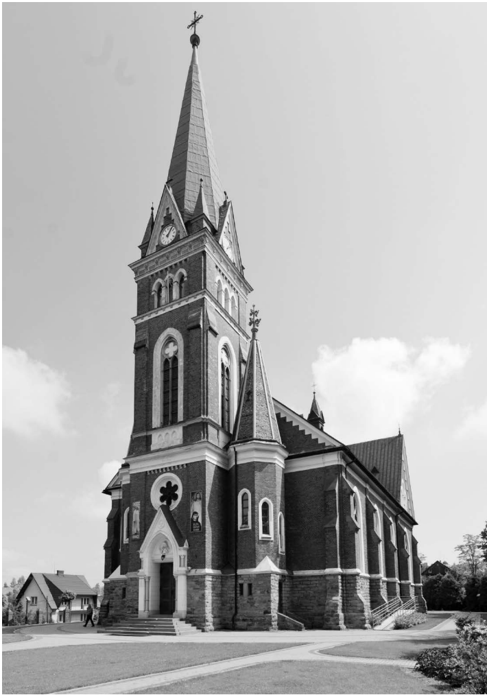
Ryc. 10. Świątynia pw. Matki Boskiej Nieustającej Pomocy w Krzeszowie, 1903 r., widok od pd. – zach.