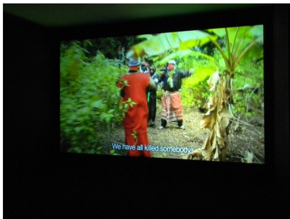
M. Boulos, All That is Solid Melts into Air (2008)