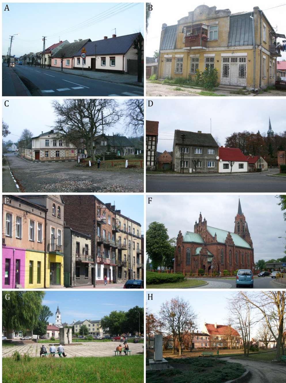
Fot. 1. Widoki z „miast-ciekawostek” w kontekście zjawisk degradacji i restytucji w Polsce

Objaśnienia: A – Bnin; B – Gniewoszów-Granica (dom na pograniczu); C – Łędyczek; D – Miasteczko Krajeńskie; E – Modrzejów; F – Niwka; G – Wierzbnik; H – Zaniemyśl.