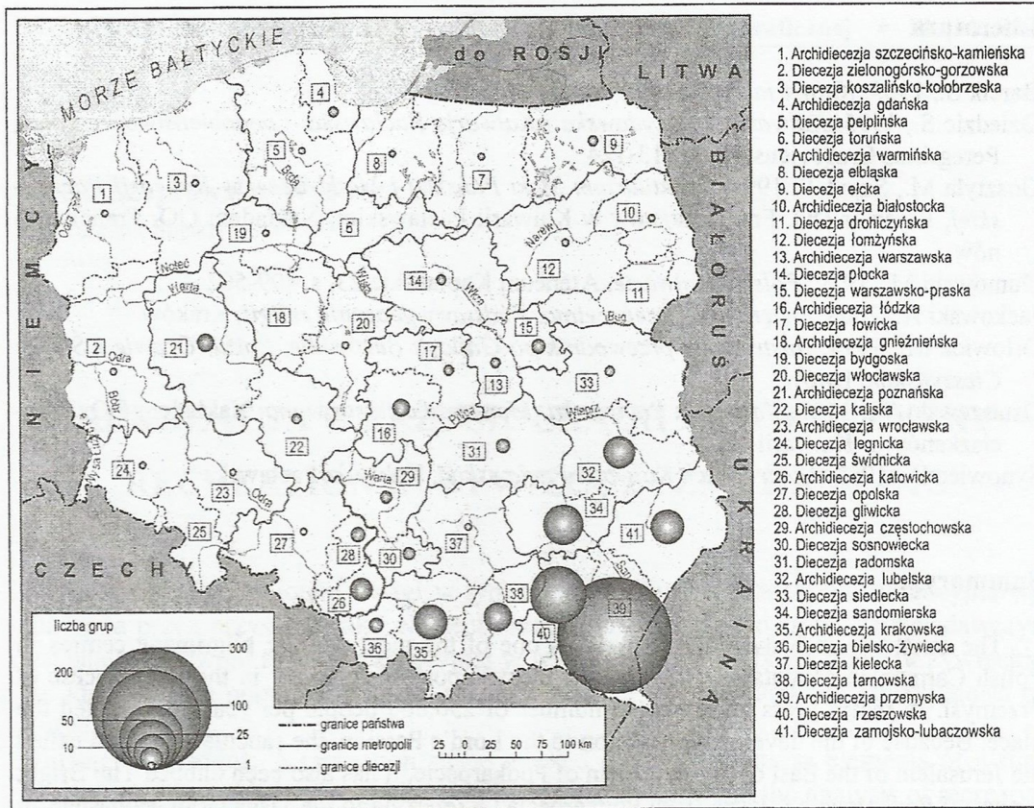
Ryc. 3. Zorganizowany ruch pielgrzymkowy do sanktuarium w Kalwarii Pałacowskiej w 2000 roku

werach – bardzo często z odległych zakątków Polski – pielgrzymujący szlakiem sanktuariów Podkarpacia.