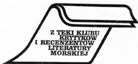
Ilustracja 6. Strona 57 „Morze i Ziemia” nr 3/81, autor Zbigniew Ryngwelski

Strona 57 rozpoczyna cykl „Z teki klubu krytyków i recenzentów literatury morskiej”.