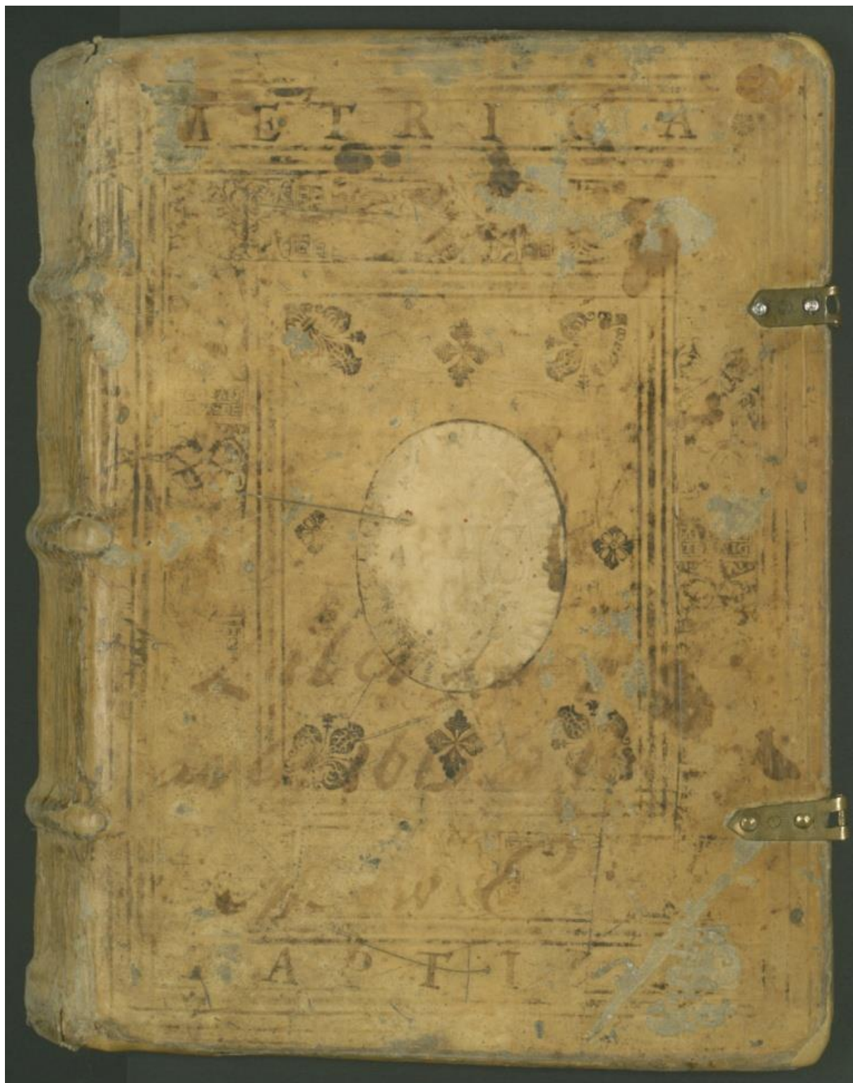
I. Przednia okładka oprawy najstarszej mstowskiej księgi metrykalnej z tłoczeniami i zatartym superexlibrisem ozdobnym inicjałem w nagłówku, pieczęciami własnościowymi: okrągłą i półkolistą (widocznymi w prawym dolnym rogu), numeracją inwentarzową (niebieska kredka w prawym górnym rogu) oraz niezidentyfikowanym rysunkiem. (APCz zespół 91, sygn. 1)