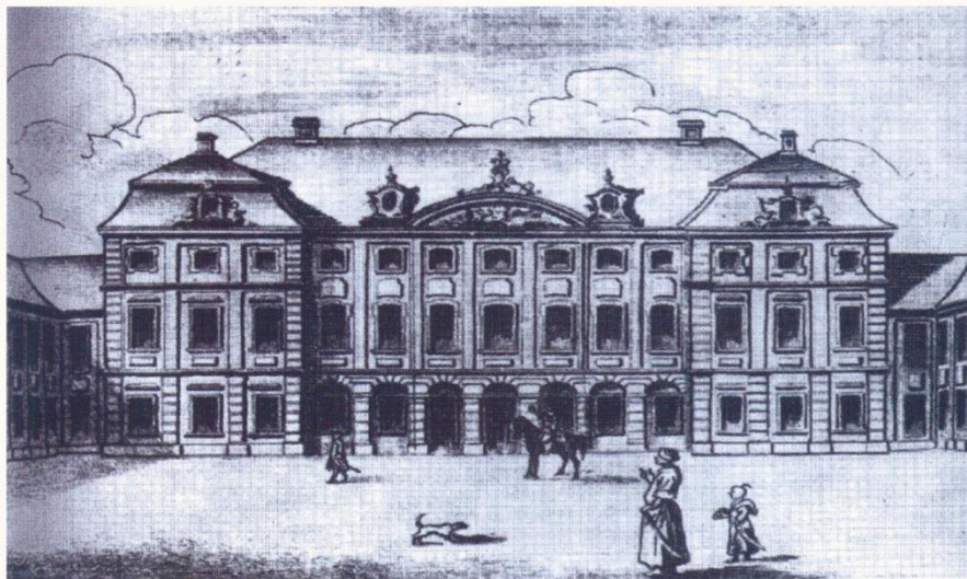
Pałac Radziwiłłowski przy Krakowskim Przedmieściu 46/48 (200 lat temu pod nr 387), w którym wynajmowano kilka pokoi na siedzibę Wielkiego Wschodu i kilku łóż warszawskich. Winieta z planu sztychowego autorstwa Pierre Ricauda de Tirregaila.