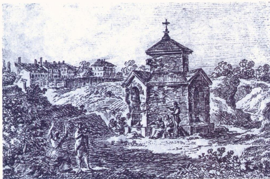
Kaplica zbudowana na bazie ośmiobocznego środkowego filaru dolnego kościoła zawierającego kamień węgielny pod planowaną Świątynię Najwyższej Opatrzności.

rozbiornie w 1794 roku Wielki Wschód zostaje zakryty i wolnomularstwo polskie zanika całkowicie. Berlińska Wielka Łoża-Matka „Royal York” w odezwie z końca 1799 r. mówiła: Polska i Litwa mogą być uważane jakoby w stanie anarchii Wolnomularskiej. Każdy system chce zająć ten Kraj zniweczając w Nim każdego współzawodnika 120 . Masoneria przetrwała tylko na terenie zaboru pruskiego, choć została wyczerpana niemal całkowicie ze wszystkiego, co w jakikolwiek sposób wiązało się z polityką. Jediną dziedziną, którą bracia mogli rozwijać na forum publicznym, była działalność charytatywna.