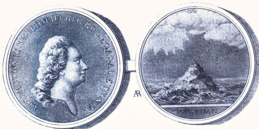
Medal wolnomularski z czasów stanisławowskich wybity w mennicy warszawskiej. (awers i rewers).