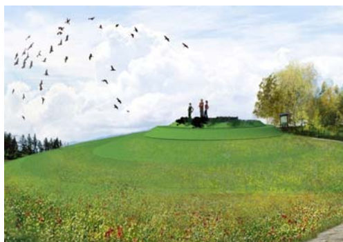
Ryc. 1. Projekt koncepcyjny tarasu widokowego na polanie w Lesie Matysowskim

(ryc. 2). Ścieżkę prowadzącą na kopiec oraz taras proponuje się utwardzić kamieniem naturalnym. W projekcie uwzględniono również miejsce na odpady. Do tego celu wykorzystano głązy kamienne (zamawiane w kamieniołomach), ustawione obok ławek. Dwa z nich służyć będą jako kosze na śmieci. Po wydrążeniu otworu, w środku kamienia umieszcza się pojemnik ze stali nierdzewnej.