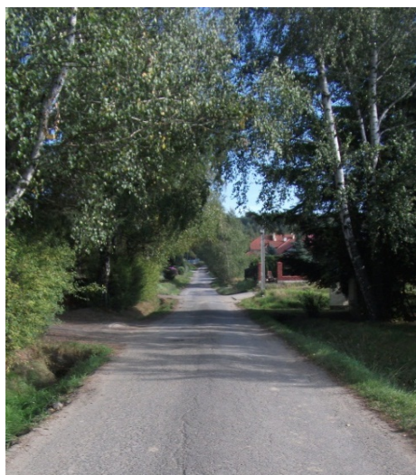
Fot. 2. Aleja brzozowa Phot. 2. Birch avenue