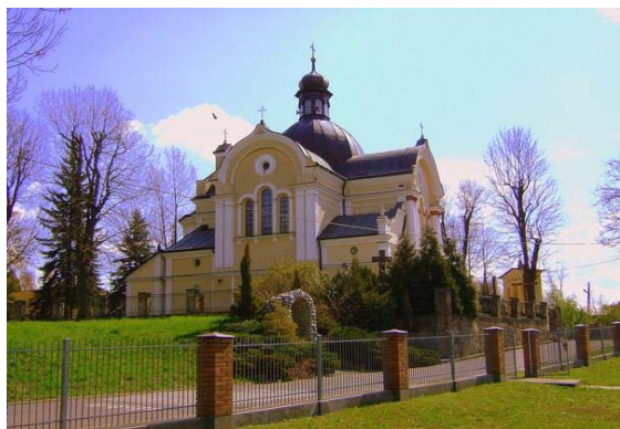
Fot. 1. Kościół i kapliczka przykościelna w Zalesiu

Wędrówkę ścieżką należy rozpocząć od mostka na rzece Czekań, przy rozwidleniu ul. Ćwiklińskiej i Zelwerowicza (początek trasy). W tym miejscu znajduje się tablica informacyjna z planem ścieżki, wiadomościami na temat długości trasy, czasu przejścia oraz zagadnienia o charakterze dydaktycznym. Kolejno należy poruszać się wzdłuż ul. Zelwerowicza drogą asfaltową i zatrzymać przy kościele, kiedyś cerkwi prawosławnej oraz kaplicy z wizerunkiem Matki Bożej Zaleskiej (przystanek 1, fot. 1).