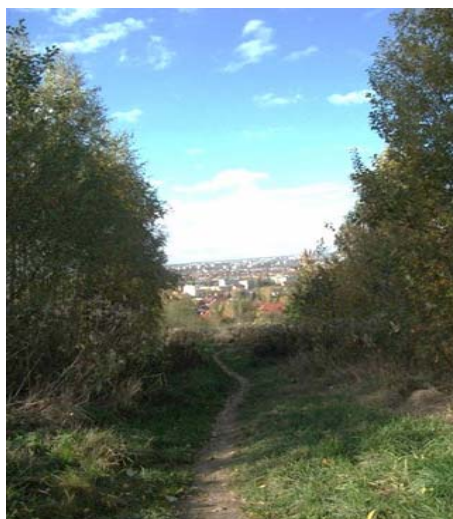
Fot. 3. Wnętrze krajobrazowe obiektywne z oknem widokowym na zabudowę mieszkalną Phot. 3. "Objective scenic interior" with a window towards residential buildings

Poruszając się dalej w kierunku południowym, przy końcu ulicy Zelwerowicza należy skręcić w prawo. Dalsza część wędrowki prowadzi między polami i wzdłuż zadrzewień śródpolnych. Na wysokości 285 m. n. p. m. wyznaczono kolejny punkt postoju (przystanek 3). Obserwator znajduje się pośrodku zadrzewień brzozowych tworzących specyficzne wnętrza krajobrazowe obiektywne z oknem widokowym (fot. 3).