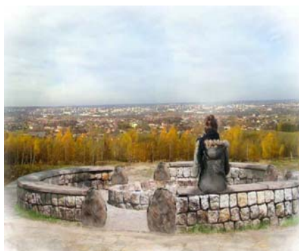
Ryc. 2. Widok ze szczytu tarasu widokowego na panoramę Rzeszowa; na pierwszym planie zaprojektowane ławki, kosze na śmieci i miejsce na ognisko

Fig. 1. Concept design for the viewing terrace on the clearing in Matysowski Forest