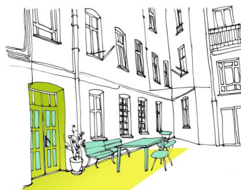
Il. 2. Niewidzialne miasto. Indywidualna kreacja przestrzeni: krzesła, stolik, ławki.