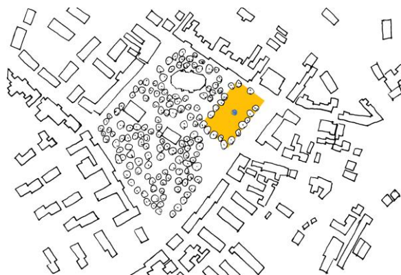
Il. 5. Drzewo życia w Olecku. Sytuacja.