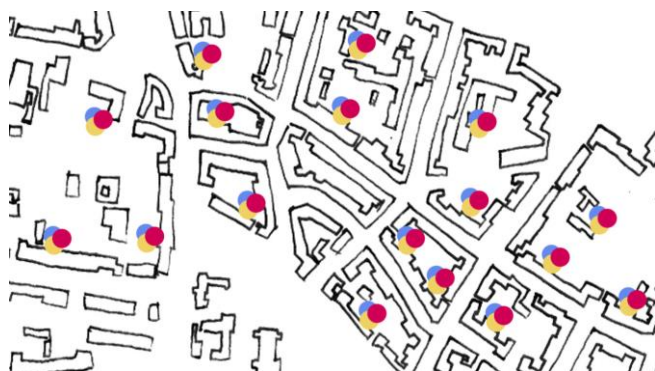
Il. 1. Niewidzialne miasto. Miejsca spontanicznych działań mieszkańców.

Identyfikacja problemów i potencjałów w odniesieniu do sposobu użytkowania wybranego fragmentu miasta powinna być zaczątkiem procesu projektowego, który miałby na celu polepszenie jakości przestrzeni użytkowanych przez społeczność lokalną. Opierając się na klasyfikacji według Jana Gehla, aktywności występujące na analizowanym fragmencie tkanki miejskiej, można podzielić na dwie kategorie: konieczne (niezbędne, np. chodzenie na zakupy), oraz rekreacyjne (dobrowolne, np. spacer). Aktywności konieczne nie wywierają bezpośredniego wpływu na rozwój aktywności społecznych, dlatego dążąc do wzmocnienia więzi społecznych pomiędzy mieszkańcami oraz wzbudzenia ogółu pozytywnych interakcji społecznych, należałoby wzbogacać strukturę miejsc aktywności rekreacyjnych (dobrowolnych). Znalezienie potencjalnych miejsc aktywności oraz wytyczenie możliwości funkcjonalnych, pozwala na określenie predyspozycji rozwojowych wybranej przestrzeni wspólnej dla mieszkańców. Kolejnym krokiem powinno być uzyskanie wytycznych projektowych, które tworzą kanwę dla różnorodnych scenariuszy zagospodarowania przestrzennego, służących poprawie standardów i jakości życia mieszkańców oraz w znacznym stopniu wyeliminowaniu bardzo często powtarzających się lokalnych problemów: niskiej aktywności społecznej, niewykształconej siatki stosunków sąsiedzkich, złego wizerunku miejsca czy zachwiania poczucia bezpieczeństwa.