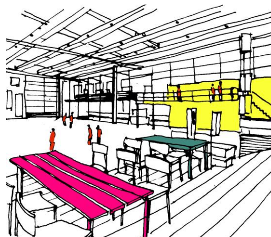
Il. 4. Agora w Dronten (Holandia). Aranżacja wnętrza.