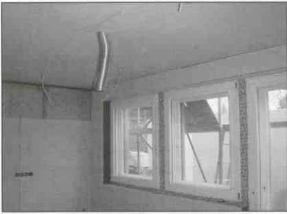
Rys. 2. Stan surowy domu pasywnego. Widoczne okna skrzynkowe, uszczelnienie i rura wentylacji.

technologii produkcji, stosowane są drewniane okna skrzynkowe. Składają się one z dwóch okien podwójnie szklonych. Przestrzeń między nimi pełni funkcję izolacyjną – dźwiękoszczelną i termiczną. W zimie uchYLENIE wewnętrzno skrzydła powoduje przepływ ogrzanego przez słońce powietrza ze skrzyni do pomieszczeń. Zaś w lecie uchYLENIE zewnętrznego skrzydła umożliwia przepływ rozgrzanego powietrza na zewnątrz chłodząc przestrzeń wewnątrz skrzyni. Pozostałe elementy domów w Systemie Lipskim są zgodne z technologią Domów Pasywnych. Dodatkowymi walorami opisywanego systemu jest możliwość prowadzenia instalacji wewnątrz przegród ponieważ rury wentylacji mechanicznej mieszczą się w grubościach przegród.