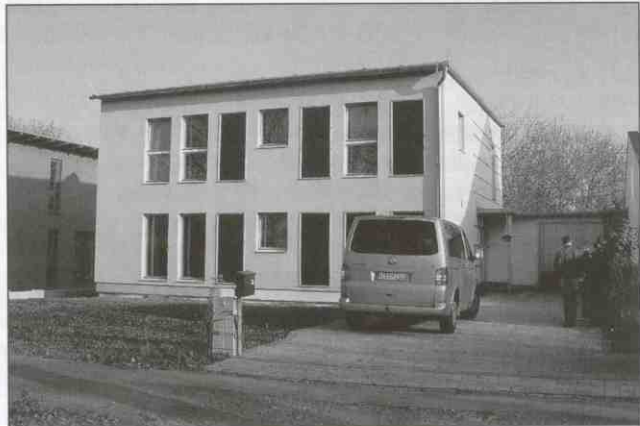
Rys. 1. Domy pasywne zaprojektowane w Biurze Naumann&Stahr zrealizowane w Lipsku. Na elewacji, obok okien, widoczne są moduły solarne.