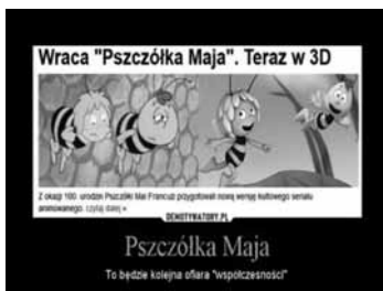
Demotywar animowany (kontrastyczny)