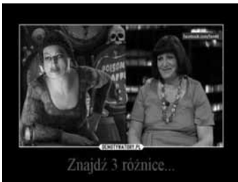
Demotywar dwuelementowy (kontrastyczny)