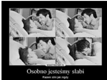
Demotywar statyczny, wieloelementowy