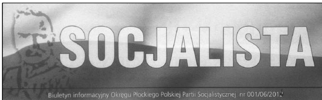
Ilustracja 4. Winieta „Socjalisty” Biuletynu Informacyjnego Okręgu Płockiego Polskiej Partii Socjalistycznej.

Do bogatych płockich tradycji prasowych PPS nawiązuje „Socjalista”, czasopismo, którego pierwszy numer ukazał się w Płocku w czerwcu 2014 r. 25