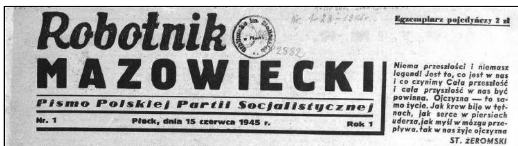
Ilustracja 2. Winieta „Robotnika Mazowieckiego” wydawanego w Płocku w latach 1945-1946.