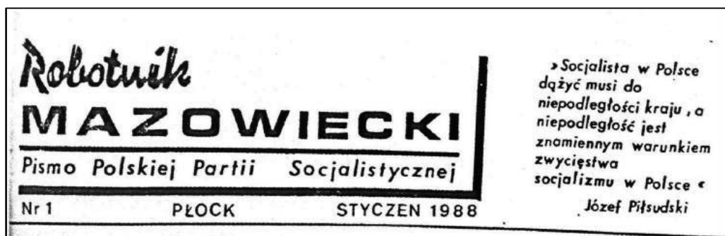
Ilustracja 3. Winieta „Robotnika Mazowieckiego” wydawanego w Płocku w latach 1988-1989.

i PPS związanej z Janem Józefem Lipskim. Proklamowano powstanie Porozumienia Prasowego PPS, w którym działały osoby m.in. redagujące „Robotnika Mazowieckiego” (Płock) i „Gazetę Jastrzębską” (Jastrzębie) 20 . Działalność TKK PPS przejawiała się w szczególności w wydawaniu prasy partyjnej. Oprócz wymienionych wyżej czasopism wydawano także: „Warszawiankę” (Warszawa), „Falę” i „Proletaryat” (Lublin), „Naprzód – Pismo Siedleckiego Komitetu Robotniczego PPS” (Siedlce), „Iskrę” (Pionki), „Robotnika Świętokrzyskiego” (Kielce), „Robotnika Śląskiego” (Wodzisław Śląski), „Robotnika Trójmiasta” (Gdańsk). Oprócz tego ugrupowanie wydawało reprint londyńskiego „Robotnika” 21 .