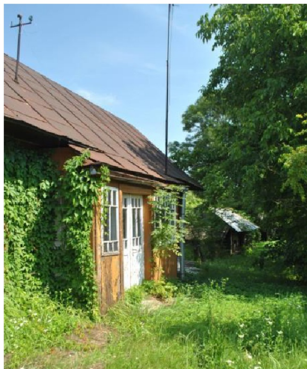
Ryc. 4. Dom z gankiem jednospadowym.