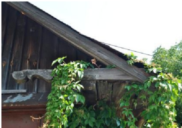
Ryc. 1. Wspornik okapowy, Lubaczów, ul. Wyszyńskiego

Być może na tym etapie rozwoju społeczno-gospodarczego warto odejść od nakazu stosowania drewna. Dzięki wprowadzeniu do miejscowych planów zagospodarowania odpowiednich zapisów można zachować w krajobrazie lokalny archetyp zabudowy, ukształtowany przez tradycyjne budownictwo. Zachować... aż dorośniemy, by do tego "najbliższego człowiekowi materiału" powrócić.