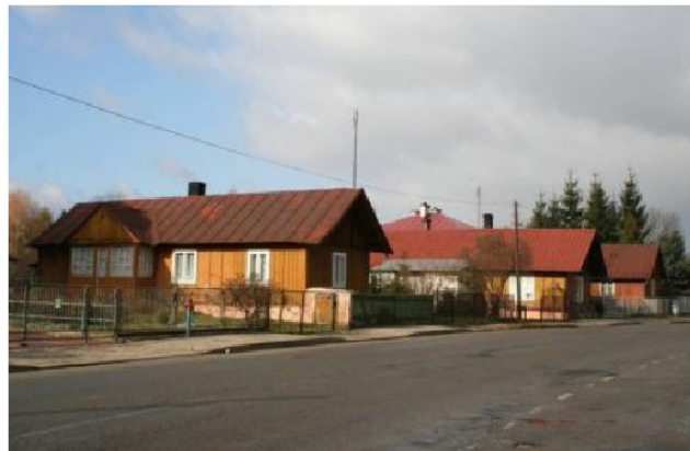
Ryc. 2. Ulica Gen. Dąbka.