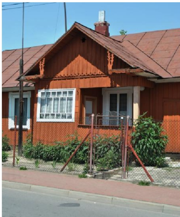
Ryc. 3. Dom z gankiem dwuspadowym, częściowo otwartym.