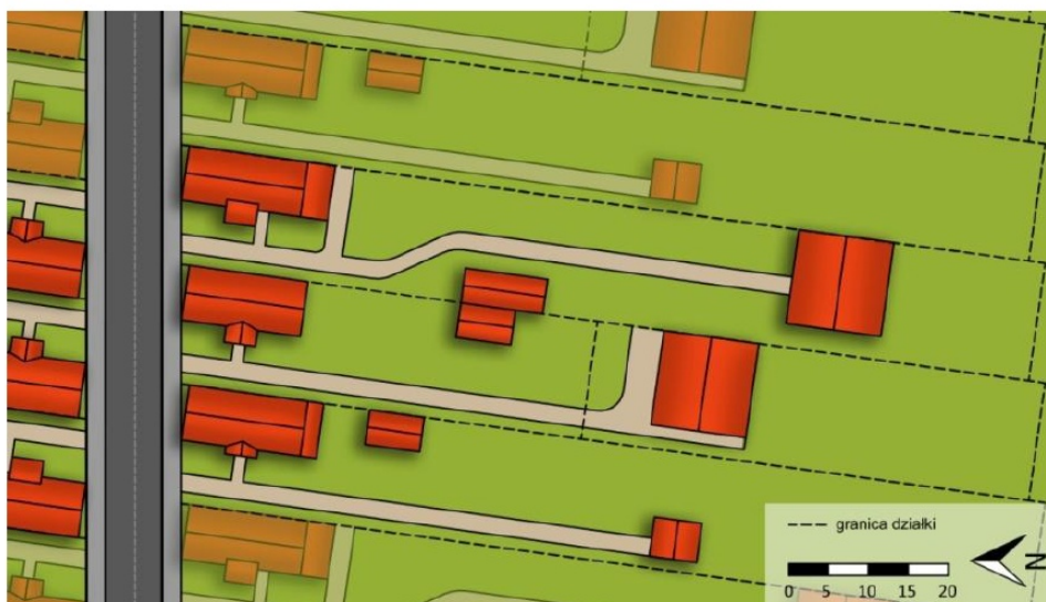
Ryc. 6. Propozycja kontynuacji tradycyjnego układu zabudowy, z rozmieszczeniem nowych budynków oraz ewentualnego podziału działek, rys. autor 2016