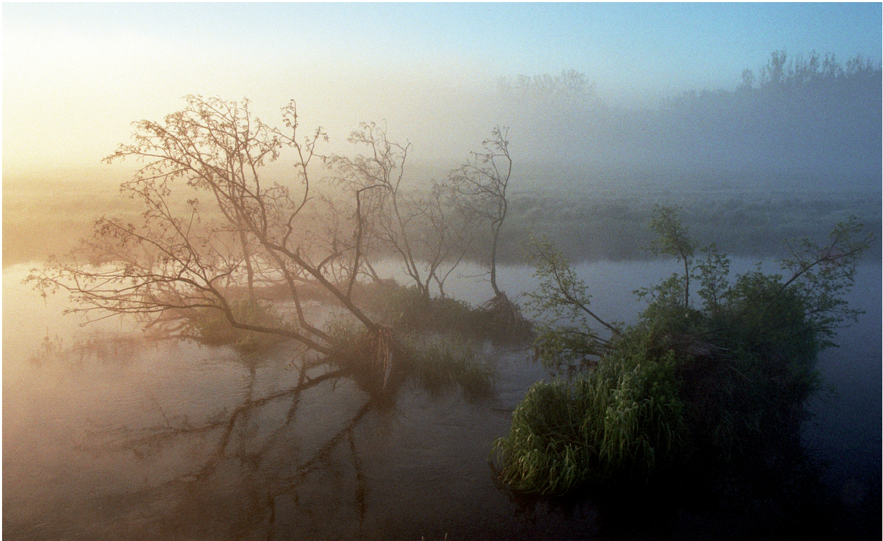
Fot 1. Rzeka Supraśl