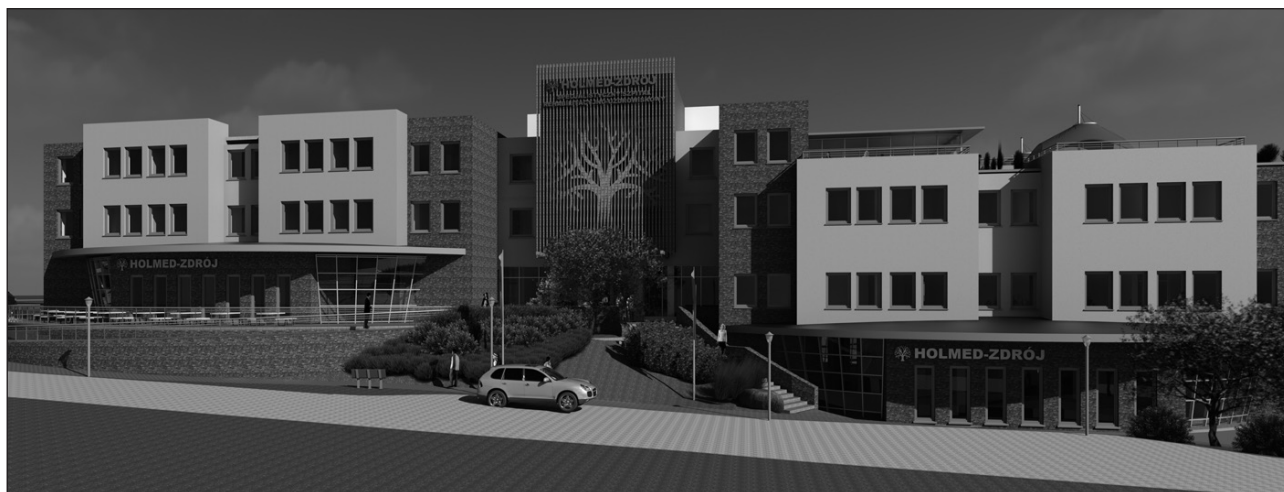
Rycina 2. Projekt szpitala uzdrowiskowego Holmed Zdrój

Władze miejscowości pomimo trudności, pozyskują inwestorów i przekonują ich do inwestycji w budowę specjalistycznych budynków. W tym roku w północno-wschodniej części miasta ruszyły pierwsze prace budowlane, specjalistycznego szpitala uzdrowiskowego. Szpital umiejscowiony jest w strefie ochrony uzdrowiskowej „A” [16].