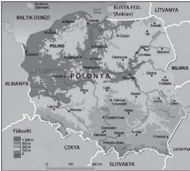
Harita 3: Polonya Cumhuriyeti Fiziki Haritası

MGY (Leh dilinde: Pojezierze Mazurskie) 3 farklı nehir havzası içinde yer almakta ve bu nehirlerin tamamı sularını kuzeydeki Baltık Denizi'ne boşaltmaktadırlar. MGY'nin büyük bölümü Polonya'nın en büyük nehir sistemini oluşturan Visla