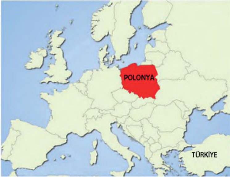
Harita 1: Polonya Cumhuriyeti Coğrafi Konum Haritası

Parlamente cumhuriyet olan Polonya 12 Mart 1999 tarihinden beri NATO üyesi, 1 Mayıs 2004 tarihinden beri AB üyesi ve 21 Aralık 2007 tarihinden beri de Schengen üyesidir. 1 Ocak 1999 tarihinden beri Polonya voyvodalık (Leh dilinde: województwo) adında 16 idari bölgeden oluşmaktadır. Her voyvodalık kendi idari merkezine, kendi meclisine ve marşal (маршал) adında meclis başkanına sahiptir. Polonya idari özellikler bakımından üç aşamalı veya üç seviyeli bir yönetim yapısına sahiptir. İller (Leh dilinde: województwo), ilçeler (Leh dilinde: powiat) ve yerleşmeler (Leh dilinde: gmina). 2012 yılında Polonya sınırları içinde 16 il (województwo), 379 ilçe (powiat) ve 2 479 yerleşme (gmina) yer almaktadır. Bu yerleşmelerin 306'sı kentsel yerleşmeler, 602'si kasaba yerleşmeleri ve 1 571'i de kırsal yerleşmelerdir. 3