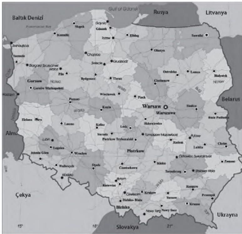
Harita 2: Polonya Siyasi Haritası

Yüzölçümü bakımından dünyanın en büyük 69'uncu ülkesi olan Polonya, nüfus sıralamasında dünyanın en büyük 33'üncü ülkesidir. 2015 yılında 38,4 milyon nüfusa sahip olan ülkede kilometre kareye ortalama 122 kişi düşmektedir. Ayrıca Polonya hem Avrupa kıtasının en kalabalık nüfuslu sekizinci ülkesidir, hem Avrupa Birliği'nin