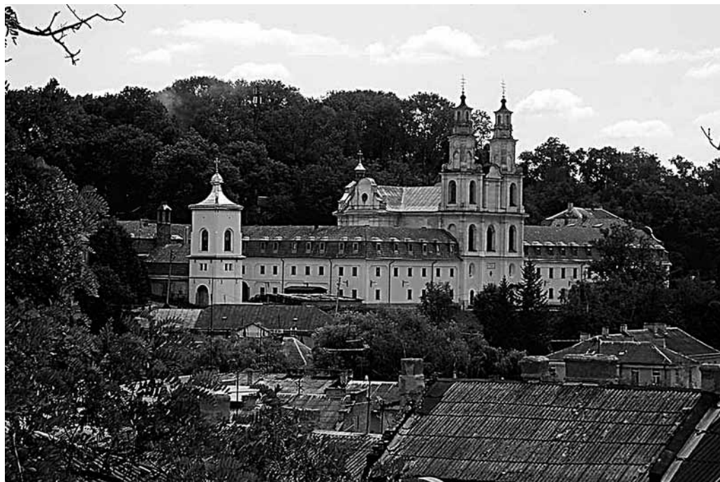
Il. 10. Buczacz. Klasztor Bazyliańców widziany z rejonu cerkwi pw. św. Mikołaja