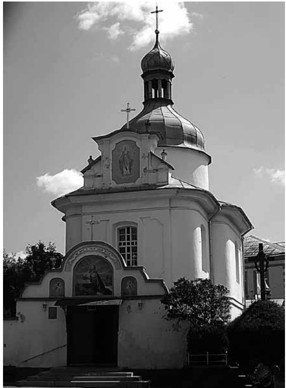
Il. 9. Buczacz. Cerkiew pw. Opieki Matki Bożej

Na wschodnim krańcu centrum, przy głównej ulicy stoi greckokatolicka cerkiew pw. Opieki Matki Bożej. Pierwsza świątynia miała tu powstać na początku XVIII w., a obecną ufundował ok. 1764 r. Mikołaj Bazyli Potocki 17 . Pomimo zamknięcia w latach 1956–1990 18 w cerkwi zachowało się cenne rokokowe wyposażenie.