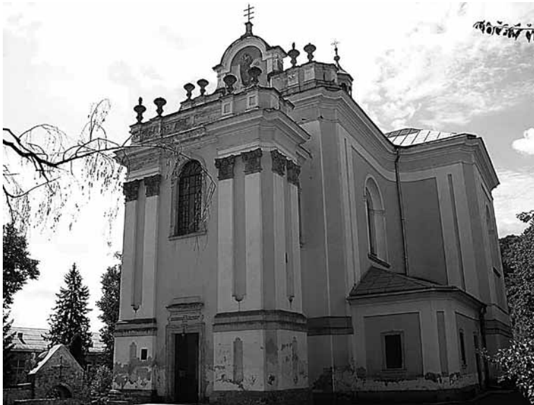
Il. 8. Buczacz. Rzymskokatolicki kościół parafialny pw. Wniebowzięcia NMP

Najbardziej okazałą świątynią Buczacza jest rzymskokatolicki kościół parafialny pw. Wniebowzięcia NMP. Znajduje się on u stóp wzgórza zamkowego, na zachód od